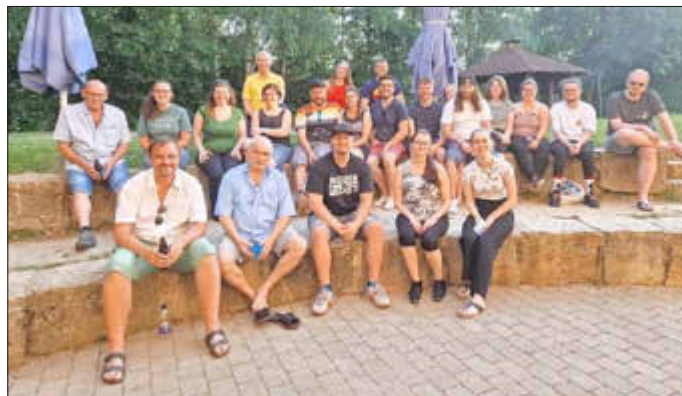
Die Musikerinnen und Musiker freuen sich, Sie zum Konzert begrüßen zu dürfen.

Erwachsene 8€, Schüler/Studenten 5€, Kinder bis 10J frei.