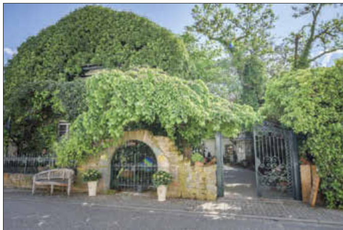
Ein ganz besonderer Ort: Das Weinessigut Doktorenhof

Am Freitag, den 21.07.2023, bietet die vhs Regionalverband eine Degustations-Fahrt zum Weinessigut Doktorenhof bei Venningen an. Die Tagesfahrt bietet die Möglichkeit, in das Mysterium saurer Kunst bei einer Führung durch den Essigkeller und die Kräuterkammer einzutauschen. Exklusive Einblicke in kerzenbeleuchtete Räume, wo die Essige in hundertjährigen Fässern gären und reifen sind ebenso Teil des Rundgangs wie Mystisches, Geschichten, Anekdoten und Wissenswertes zur Herstellung und Wirkweise sowie Kulinarisches rund um den Essig. An die Führung schließt sich eine Verkostung von Edelessigen und sinnlich-verführerischen Essigpralinen an. Es wird in die Kunst des Essigtrinkens eingeführt und die Geschmacksvielfalt der unterschiedlichsten Kreationen kennengelernt. Nicht nur als anregender Aperitif, sondern auch für kräftigen Käse, Fisch und Meeresfrüchte, Blumensalate, Pilzgerichte und mediterrane Köstlichkeiten eignet sich ein edler Weinessig mit anregenden Kräutern und Essenzen.