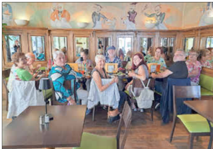
die illustre Gesellschaft vor dem Theaterbesuch in der Kartoffel

Liebe Mitglieder und Freund*innen des AWO OV Riegelsberg-Walpershofen. Nach einem erfolgreichen, verlängerten Wochenende mit dem Kaffeenachmittag am Freitag und dem Besuch im SST und im Restaurant Kartoffel in Saarbrücken am Samstag, geben wir euch die weiteren geplanten Aktivitäten bekannt: