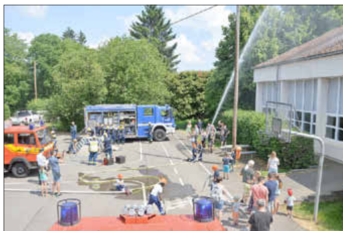
Die Zusammenarbeit bei der gemeinsamen Übung von Feuerwehr, DRK und THW klappte hervorragend.

jugendfeuerwehr@ff-riegelsberg.de oder kinderfeuerwehr@ff-riegelsberg.de