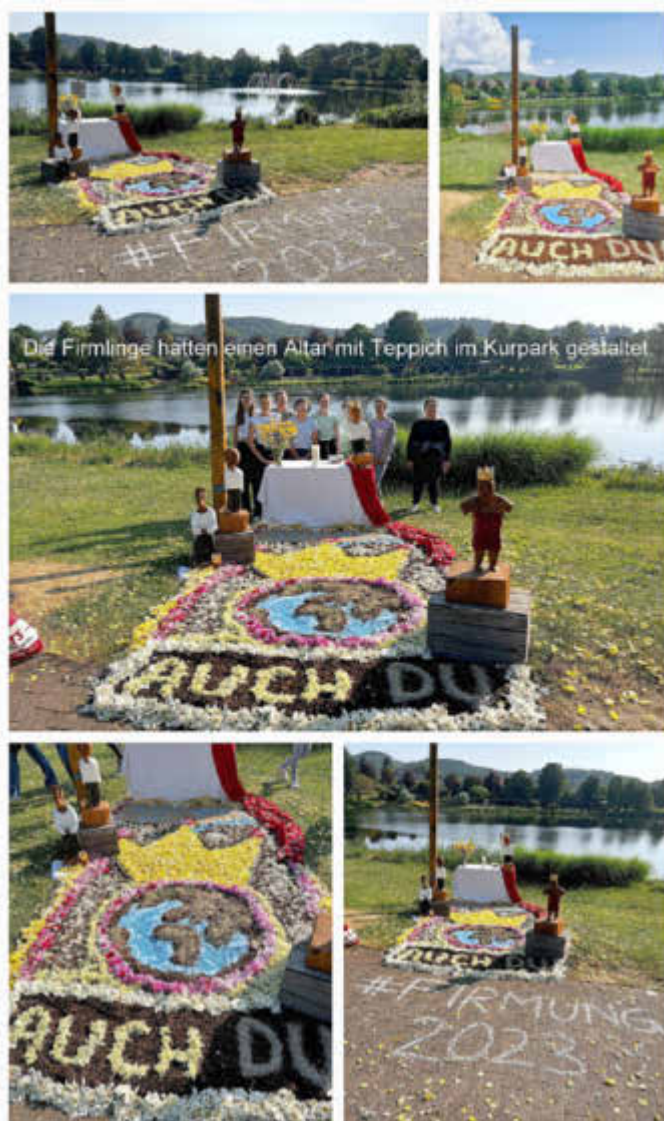
Die Firmlinge hatten einen Altar mit Teppich im Kurpark gestaltet