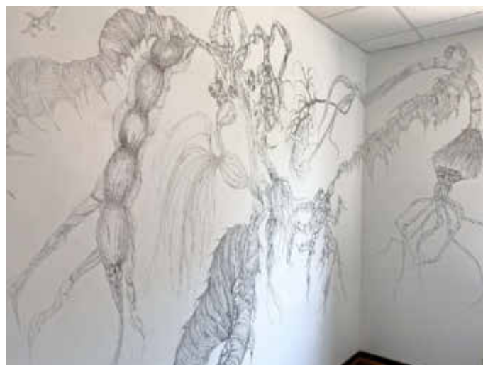
Julia Baur - Wandarbeit Hybride XXXL

Im Museum Schloss Fellenberg in Merzig sind vom 22. Juni bis 10. September donnerstags, freitags und sonntags von 14 bis 17 Uhr Werke des grenzüberschreitenden Kunstprojektes SaarArt 2023 ausgestellt. Die Schau lenkt dabei den Blick auf die Großregion: Unter dem Motto „Au rendez-vous des amis“ präsentieren sich im Élysée-Jahr 2023 erstmals auch Kunstschaffende aus Lothringen und Luxemburg.