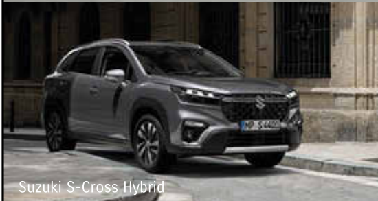
Suzuki S-Cross Hybrid