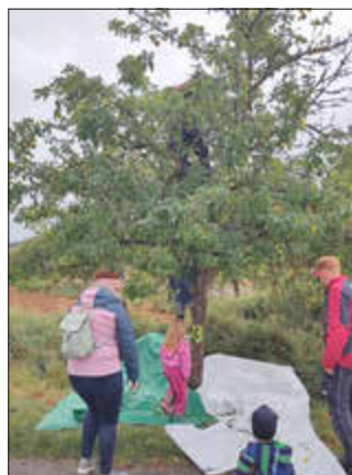
Groß und Klein packen mit an bei der Apfelernte

Zum einen wurde ein neuer Landtag gewählt . Besonders dabei war, dass es eine Nachwahlbefragung vor dem Wahllokal im HdG gab. Das bedeutet, die Wähler und Wählerinnen wurden nach der Stimm-Abgabe für die 18-Uhr-Prognose der ARD befragt – freiwillig und anonym natürlich. Die Wahlbeteiligung (inkl. derjenigen die Briefwahl beantragt haben) kann sich im Übrigen mit rund 75% sehen lassen!