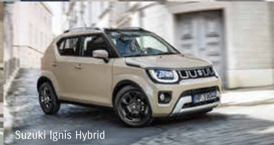
Suzuki Ignis Hybrid

Abbildungen zeigen aufpreispflichtige Sonderausstattung.