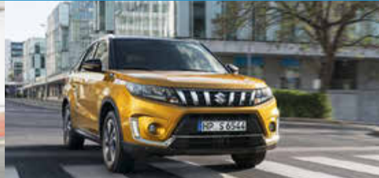
Suzuki Vitara Hybrid