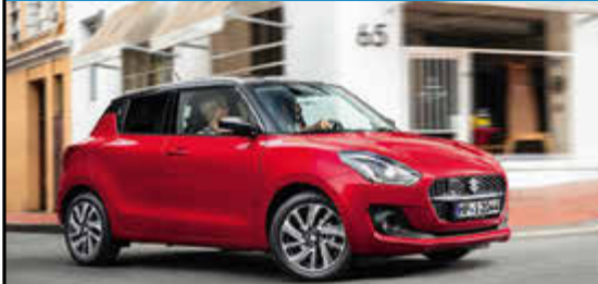
Suzuki Swift Hybrid