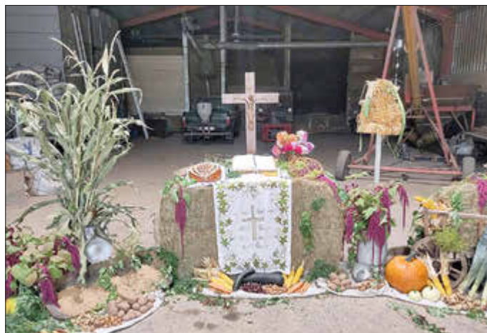
Erntedankgottesdienst in Rennerts Scheune

alles aufgegessen wurden. Wenn am 28. Oktober der Arbeitseinsatz auf dem Friedhof stattfindet, wird das „Schnuddelcafé“ ein Frühstück für die fleißigen Helfer ausrichten. Danke für so viel Engagement!