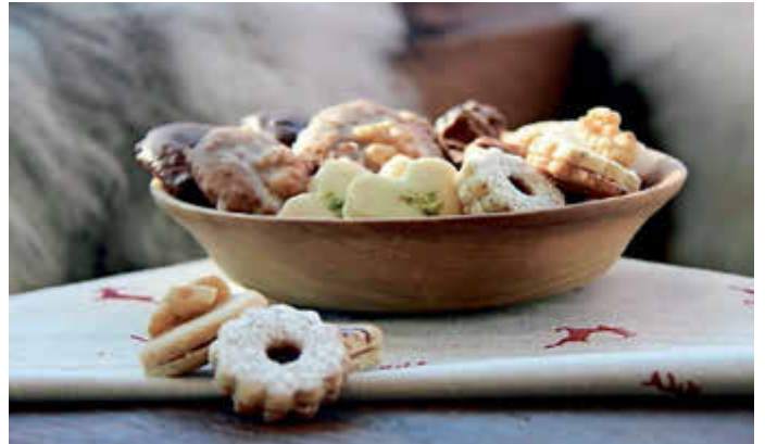
Mit heimischen Backzutaten wie Butter, Mehl, Gewürze macht das Backen nochmal so viel Spaß. Die Regio-Zutaten gibt's im Milchladen der Molkerei Berchtesgadener Land, die Rezepte dazu online: https://bergbauernmilch.de/de/rezepte/plaetzchen.html