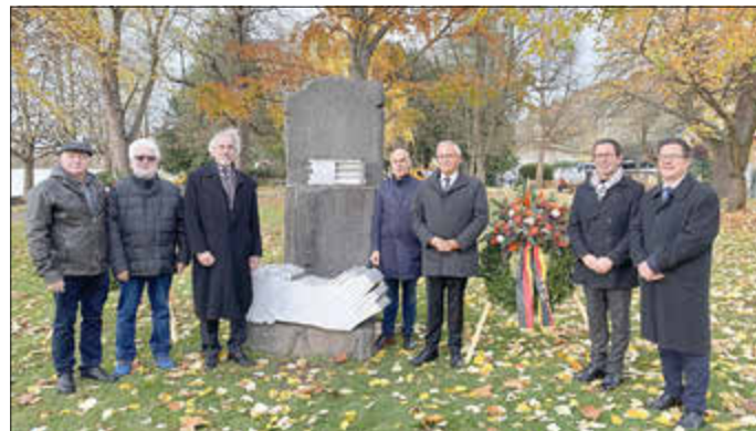
Vertreter der Kommunen und Vereine nahmen an der Gedenkstunde zum Volkstrauertag teil.

Die Kirche sehe es als Aufgabe an, den Export von Waffengütern mit kritischem Blick zu begleiten und eine restriktive Bewilligungspraxis immer wieder anzumahnen. Seit jeher laute die Forderung christlicher Friedensbewegungen „Frieden schaffen ohne Waffen“. Sie würden sich auf die Bergpredigt berufen: „Seelig, die keine Gewalt anwenden, denn sie werden das Land erben“. Dann auf die Ukraine und Gaza bezogen, sagte Anhalt: „Gewalt und Gegengewalt, auch wenn sie legitim ist, treiben die Spirale der Gewalt an. Gewalt im Krieg verursacht nicht nur Gewalt, sondern befeuert auch den Hass auf den Gegner. Und ein durch Hass vergiftetes, kollektives Bewusstsein der Völker macht den Frieden über Grenzen hinweg unmöglich. Deshalb muss der Horizont des Friedens auch in Zeiten des Krieges geöffnet bleiben“.