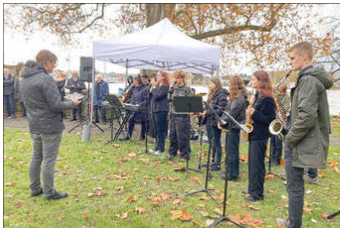
Schüler des Martinus-Gymnasiums umrahmten die Gedenkstunde musikalisch.