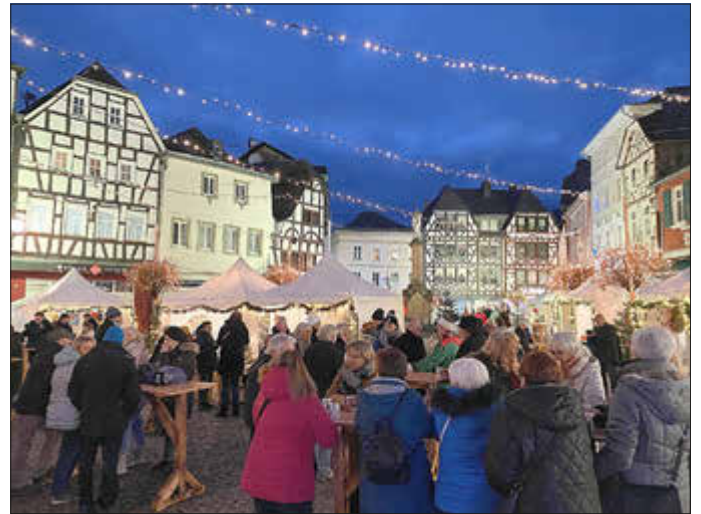
Am Freitag wurde der Weihnachtszauber auf dem Linzer Marktplatz eröffnet