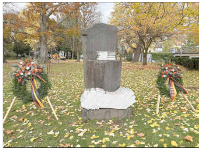
Die Gedenkstunde fand an der Skulptur des Linzer Künstlers Oellers statt.

und schwierige Auseinandersetzung einzustellen, allerdings ist eine Haltung der Entschlossenheit und Eindeutigkeit jenseits der Hysterie und des Lavierens nötig, um diese Herausforderung zu bestehen“, sagte Anhalt. Debatten um Waffenlieferungen gebe es auch in den Kirchen, zitierte Anhalt deren hochrangige Vertreter.