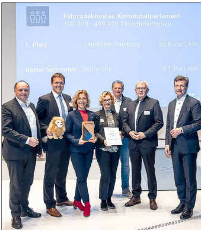
Preisverleihung 1. Platz fahrradaktivstes Kommunalparlament bei der STADTRADELN-Abschlussveranstaltung in Köln