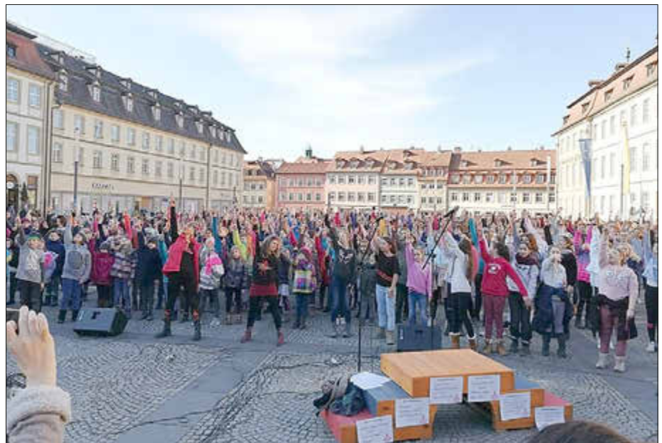
One Billion Rising