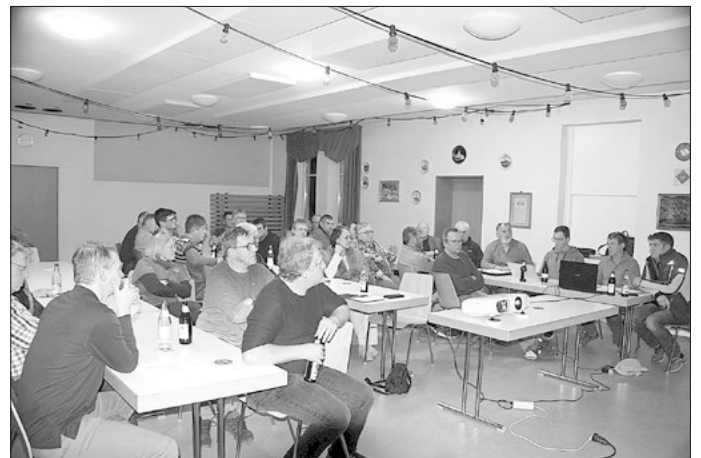
Gut besuchte Jahresversammlung der Bioenergie Degersheim. Rechts im Vordergrund Aufsichtsrat und Vorstand