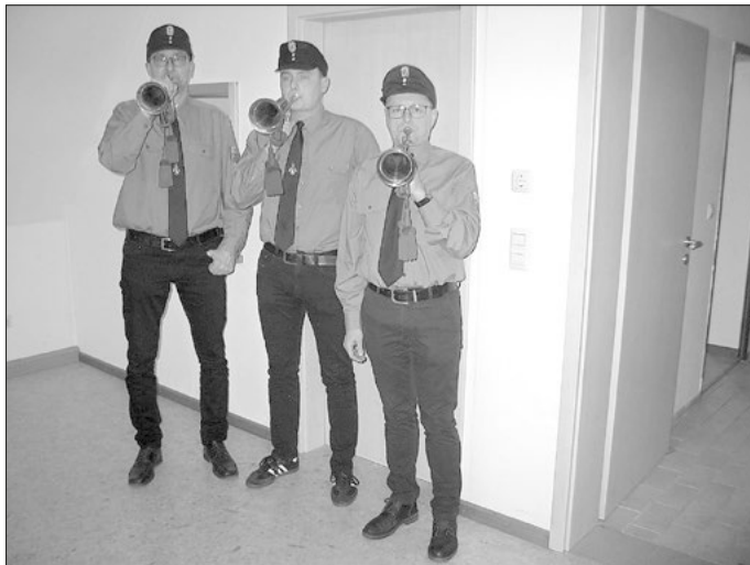
Die Fanfarenbläser eröffneten die Versammlung.