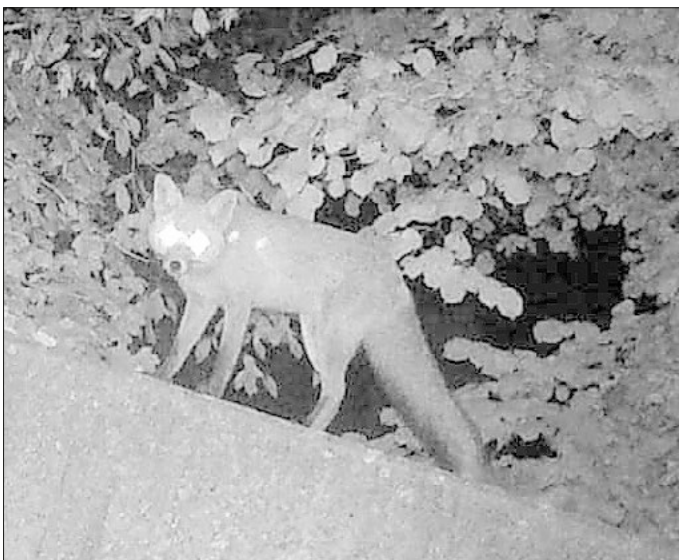
Einer der Füchse wurde von einer Nachtsichtkamera erfasst.

Bei dem Eigentümer geht es nicht nur um den Verlust, sondern um die Ungewissheit, neues, oft mit Liebe aufgezogenes Feder- vieh wieder zu verlieren.