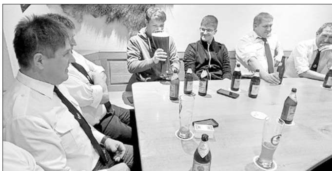
Die zwei neu aufgenommenen Kameraden stellen ihre Trinkfestigkeit unter Beweis