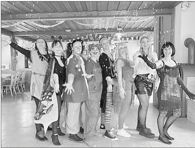
Das Organisationsteam des Kinderfaschings