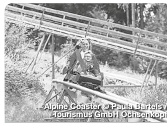
Alpine Coaster

Längst gilt die Therme als mehrfach ausgezeichnete „Perle“ der Fränkischen Schweiz. Das mineralhaltige Thermalwasser kommt aus Urtiefen des Juragesteins. Das Wasser belebt und entspannt zugleich. An der Therme 1, Mistelgau-Obernsees