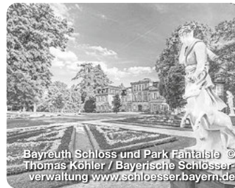
Bayreuth Schloss und Park Fantaisie © Thomas Köhler / Bayerische Schlösserverwaltung www.schloesser.bayern.de