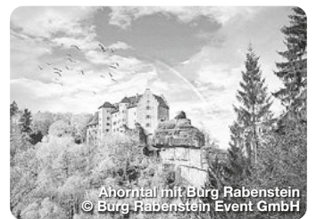
Ahorntal mit Burg Rabenstein © Burg Rabenstein Event GmbH

Genießen Sie ungeahnte Aussichten und Einblicke schon während der gut 700 m langen Bergauffahrt bevor Sie sich in die über 1.000 m lange, überaus abwechslungsreiche Abfahrt stürzen. Fröbershammer 27, Bischofsgrün