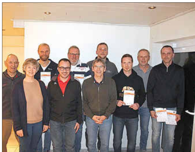
Sportabzeichenverleihung bei der Jahreshauptversammlung der Leichtathletikabteilung