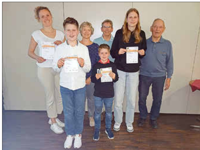
Jubiläumssportabzeichen wurden vom Sportkreis bei einer Ehrung am 02.05.2024 verliehen.