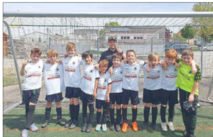
Bericht und Foto: Marta Pest

Der gegnerische Trainer schrie nur immer „Lasst die Nummer 9 (Leo L.) nicht schießen“. Das heizte Leo nur noch mehr auf und so gelang ihm das 1:3 und zugleich auch der Endstand.