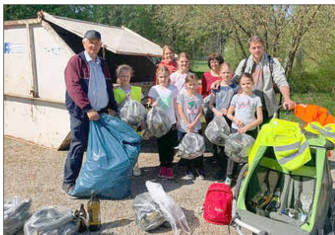
Müllsammeln kann sogar Spaß machen!

Am Samstag, 13. April haben sich die Grashüpfer bereits um 8:30 Uhr am Sportplatz verabredet, um mit Warnwesten und Müllbeuteln ausgestattet bei der Waldsäuberung mitzuhelfen. Die Strecke ging durch Muttershofen, über die alte Eiche und zurück über den Monburger Wald. Das Wetter war super und die Müllbeutel am Ende gut gefüllt. Zum Schluss wurde im Feuerwehrhaus zusammen mit den Reservisten ein leckeres Mittagessen verputzt.