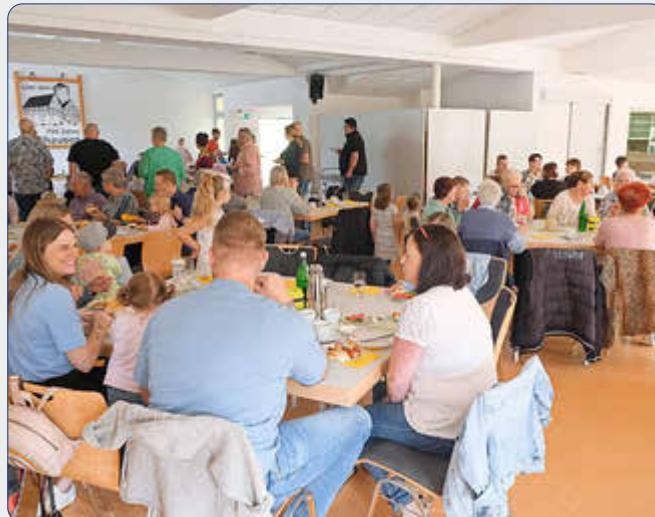
Gut besucht: Viele Eltern, Kinder und Gäste ließen es sich auf Einladung der Kinderkrippe gut gehen.