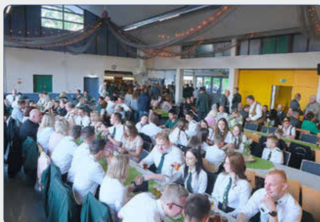
Viele Tradition und beste Stimmung: Der Festkommers war gut besucht.