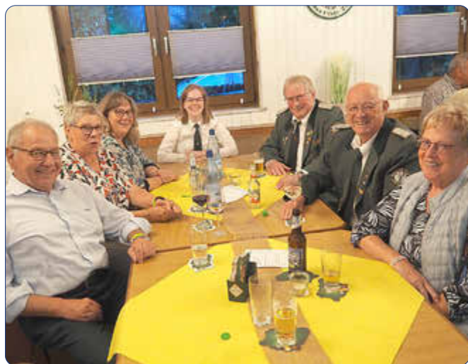
In froher Runde feierte diese Gesellschaft Schützenfest im Schützenhaus.