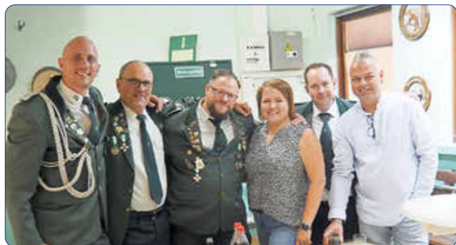
Im Endspurt des Vogelschießens beriet diese Kommission über die Reihenfolge des Schießens der Königsanwärter.