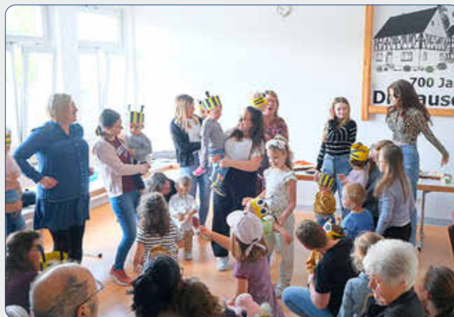
Passend zum Thema des Tages führten die Kinder einen Tanz mit Bienen-Kopfbedeckung auf.