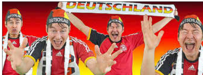
Public-Viewing-Veranstaltungen zur Fußball-Europameisterschaft sind genehmigungspflichtig.

Von den insgesamt 51 Spielen beginnen 26 Spiele um 21 Uhr. Da die Ausrichter von „Public-Viewing“-Veranstaltungen die sonst üblichen Lärmschutzstandards an vielen Orten nicht einhalten können, wird diese zeitlich befristete Ausnahmeregelung notwendig. Sie gilt für die gesamte Dauer der Fußball-Europameisterschaft 2024 (14. Juni bis 14. Juli). Der Veranstalter muss möglichst frühzeitig bei der Immissionsschutzbehörde der Kreisverwaltung einen formlosen Antrag stellen. Das Antragsformular sowie weitere Hinweise finden sich auf der Homepage des Landkreises. Der ausgefüllte und unterschriebene Antrag soll dann per Mail an Immissionsschutz@Limburg-Weilburg.de geschickt werden.