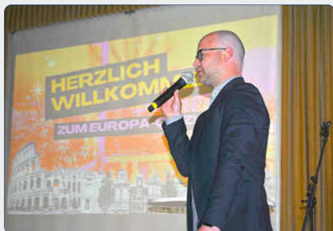
Begrüßung durch Bürgermeister Melchert.