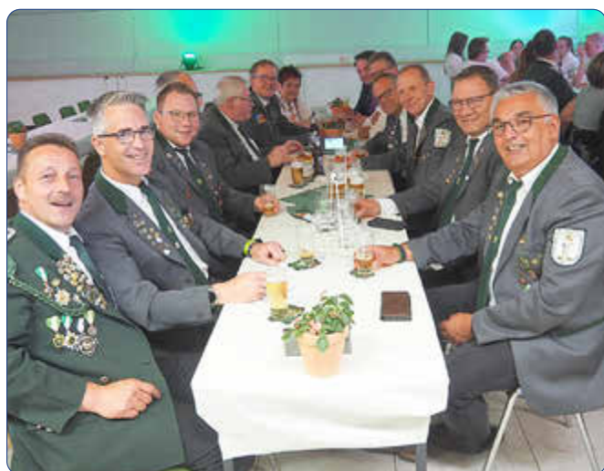
Mit einer großen Abordnung nahm der Winkeler Schützenverein „St. Sebastian“ am Schützenfest in Mengerskirchen teil.