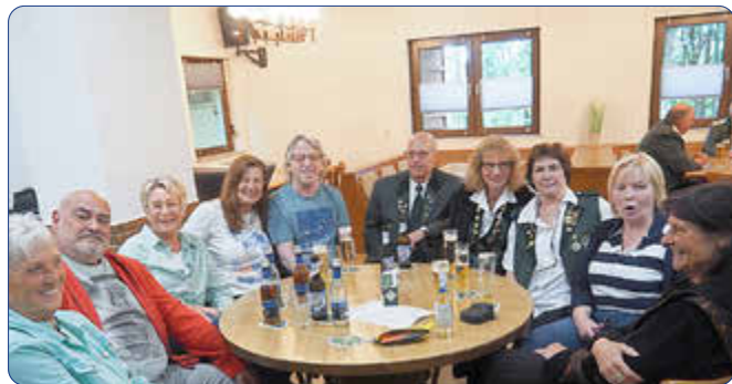
Gespannt wartete diese illustre Gesellschaft auf das Ergebnis des Vogelschießens.

Das Schützenfest klang mit einem Festgottesdienst, der musikalisch von den Zimberg-Musikanten mitgestaltet wurde, der Totenehrung auf dem Friedhof mit den Zimberg-Musikanten und den Sängern des MGV „Freude“ sowie einem zünftigen Frühschoppen im Schützenhaus aus.