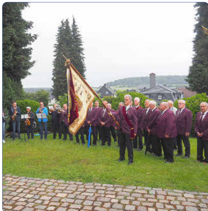
Die Zimberg-Musikanten und der MGV „Freude“ gestalteten musikalisch die Totenehrung des Schützenvereins auf dem Friedhof.