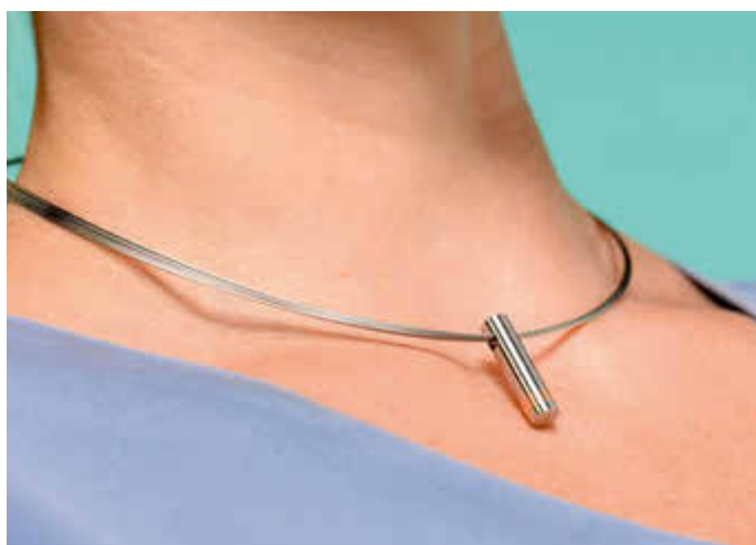
Erinnerungsschmuck als Anhänger einer Halskette: In einer Kammer können Haare oder Asche des Verstorbenen eingeschlossen sein.