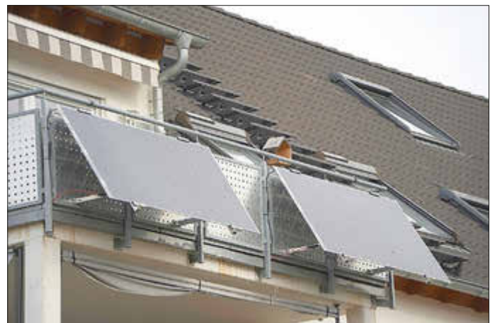
Mit KIPKI-Mitteln fördert die Stadt Idar-Oberstein die Anschaffung von Balkonkraftwerken.

Am Dienstag, 16. Juli 2024, um 18.30 Uhr findet im Sitzungssaal der Stadtverwaltung Idar-Oberstein eine Informationsveranstaltung zum Thema „Solaroffensive – Kohle sparen mit Sonnenschein“ statt. Dabei erhalten die Teilnehmer allgemeine Informationen zu technischen und rechtlichen Grundlagen der Stromerzeugung mit Photovoltaik-Anlagen (PV-Anlagen), außerdem wird auch das neue städtische Förderprogramm „Steckerfertige Balkon-PV-Anlagen“ vorgestellt. Veranstalter sind die Stadt Idar-Oberstein und der Nationalpark Hunsrück-Hochwald im Rahmen des Projektes ZENAPA (Zero Emission Nature Protection Areas). Zur Vorbereitung der Veranstaltung wird um vorherige Anmeldung gebeten.