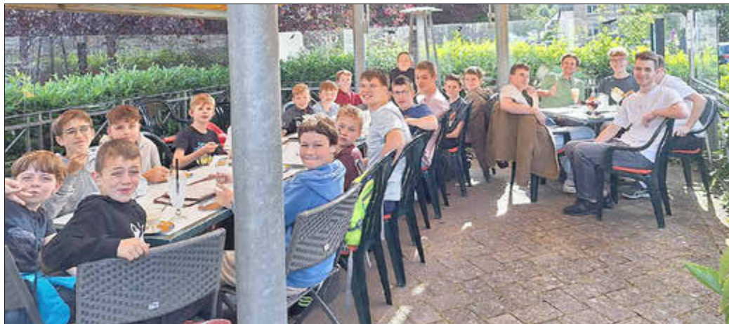
Nach dem Bowling ließen es sich die Kinder in der Eisdielen schmecken.