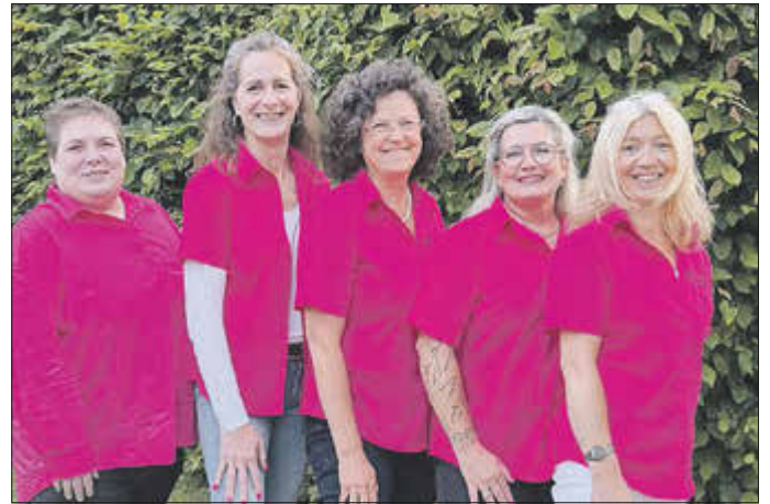
Der fidele Vorstand aus Kempenich.