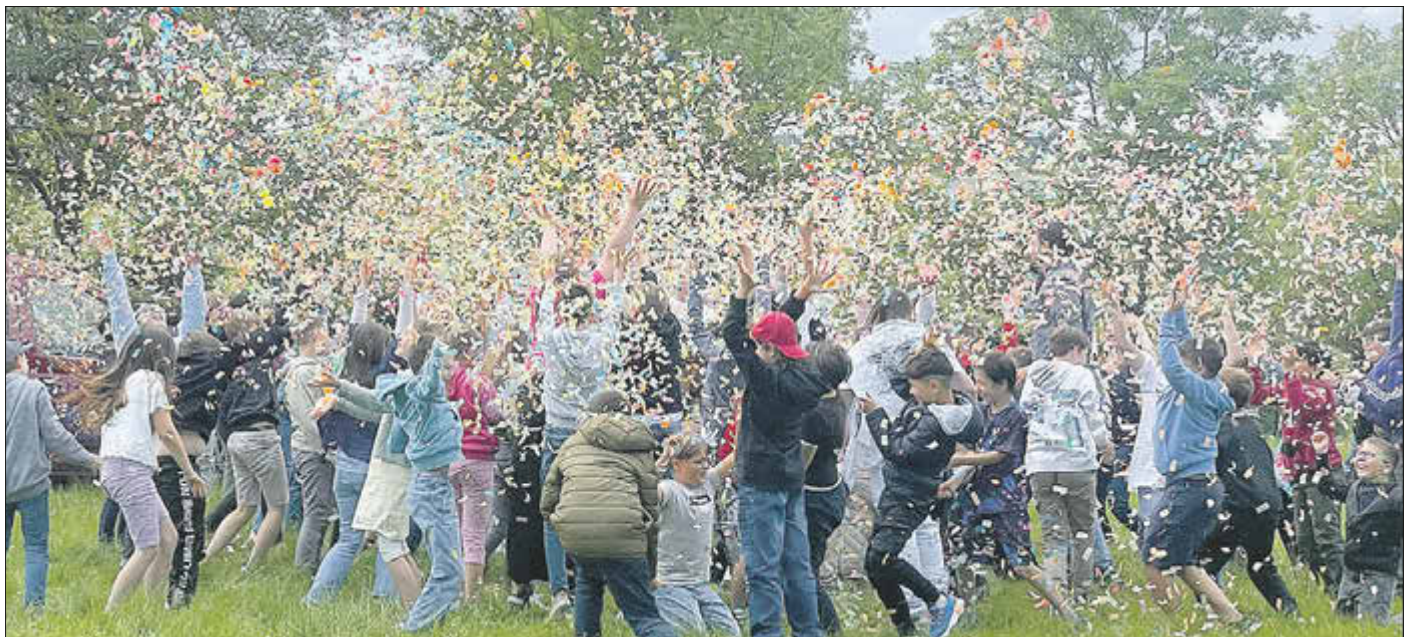
Konfettiparade auf der Schulwiese.