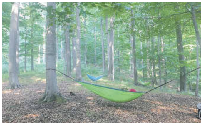
In der Hängematte das Blätterdach bewundern und die Seele baumeln lassen

GLEES / WASSENACHER WALD. Unterwegs auf Pfaden geht es am Sonntag, 30 Juni, ab 10 Uhr , schlendernd und achtsam durch die Natur. Innehalten an schönen Plätzen, lauschen, staunen und bewusst den Wind und den Duft wahrnehmen. Abschalten vom Alltag, die wohltuende Waldatmosphäre wirken lassen und ganz im Hier und Jetzt ankommen. Die gesunde Waldatmosphäre trägt zur Entspannung bei, reduziert die Stresshormone, stärkt das Immunsystem und reguliert den Blutdruck. Die bewusste Zeit im Wald hat somit entschleunigende und gesundheitsfördernde Wirkung auf Körper, Geist und Seele, wie bereits in vielen Studien belegt wurde. Man riecht, fühlt, sehen, schmecken intensiv und lassen damit den oftmals hektischen Alltag hinter uns. Durch das Entschleunigen in der Natur schöpfen wir neue Kraft und Lebensfreude. Atem-, Meditations- und Sinnesübungen sind Teil des Waldbades, ebenso wie eine Solozeit (Eigenerfahrung) z. B. in der Hängematte zwischen zwei Bäumen das Blätterdach bewundern und die Seele baumeln lassen. Ein gemeinsames Waldpicknick mit Tee, Obst und Gebäck, Crackern und Dip rundet das wohltuende Naturerlebnis ab. Weitere eigene Getränke und etwas zu essen können gerne mitge-