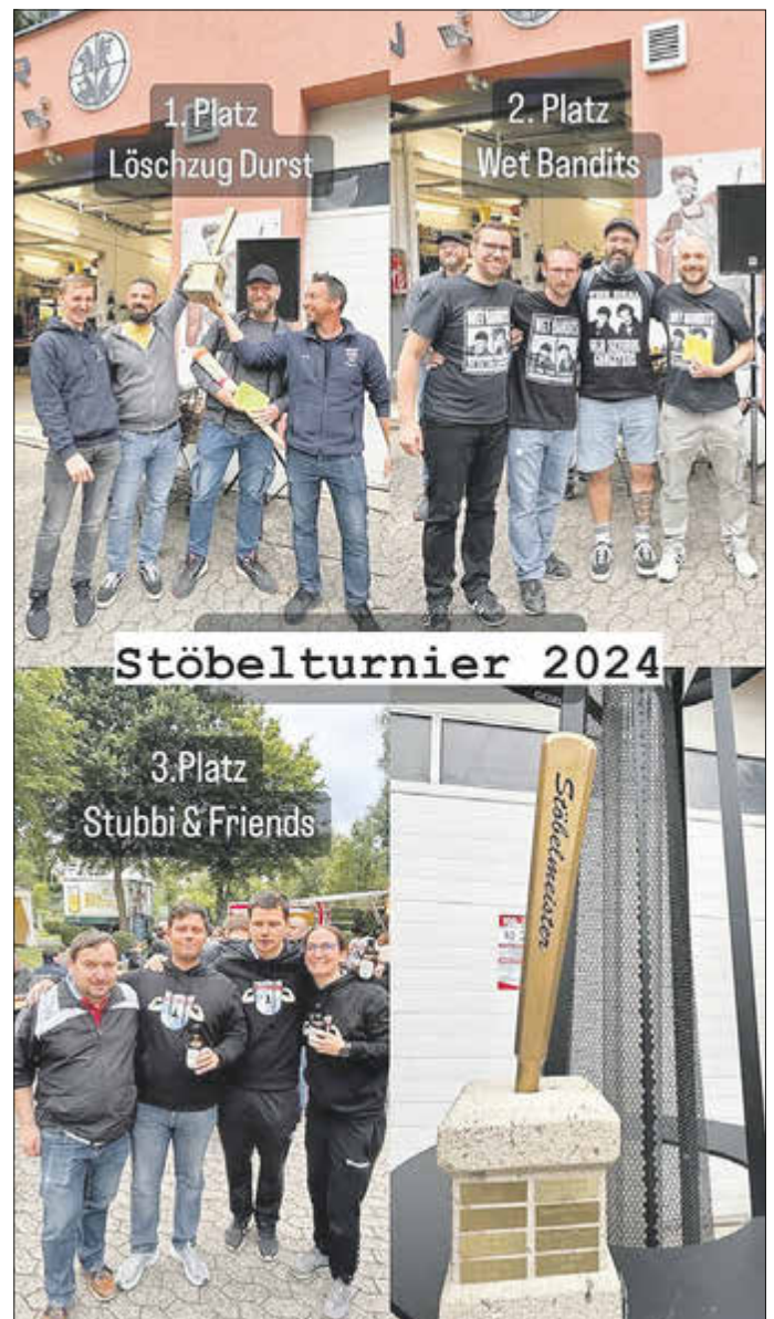
Die drei erstplatzierten Teams mit dem Wanderpokal