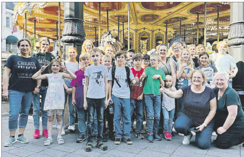
Gut gelaunte Reisegesellschaft in Brühl

DEDENBACH / BRÜHL. Am 8. Juni startete vom Bahnhof Sinzig aus die Vereinsfahrt für Kinder ab dem Grundschulalter vom Verein „Wir für unsere Kinder Dedenbach e.V.“ ins Phantasialand nach Brühl. Das Wetter spielte mit, der Zug war pünktlich und bis auf ein Kind auch alle Teilnehmer gesund. Vor Ort angekommen genossen die jüngeren Teilnehmer erstmal eine Fahrt auf dem historischen Pferdekarsell, während die Älteren sich zu den ersten Achterbahnen aufmachten. Gegen 17.30 Uhr trafen auch alle pünktlich am Treffpunkt ein, und die Rückreise konnte angetreten werden. Das Betreuungsteam freute sich über einen reibungslosen Ablauf, kein Heimweh, keinen Verletzten, das Niemand verloren gegangen ist, stattdessen nur freudige und müde Gesichter. Eine Tour dieser Art soll nicht die Letzte gewesen sein, ein Zoobesuch ist in Planung.