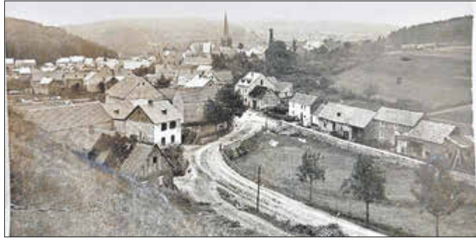
Archivbild: Kempenicher Hinterdorf um 1908

Dorf lag. Etliche Häuser wurden erst um 1900 errichtet. Fast jedes Haus hatte mit der Landwirtschaft zu tun. Heute gibt es noch eine einzigartige Ausstel-