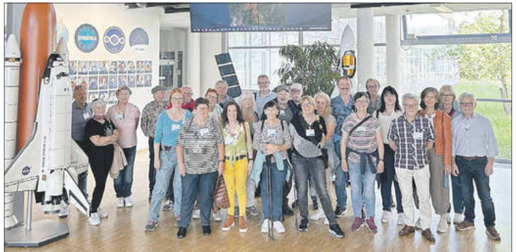
Sie schauten in den Weltraum.

Nachdem eingangs die aus dem Weltraum zurückgekehrte Sojus-Kapsel besichtigt wurde, lernte die Gruppe einige andere Institute kennen, die das Forschungszentrum der Bundesrepublik Deutschland für Luft- und Raumfahrt bilden. Diese Zentren betreiben Forschung und Entwicklung in Luft- und Raumfahrt, Energie, Verkehr, Sicherheit und Digitalisierung. Die Deutsche Raumfahrtagentur ist für die Planung und Umsetzung der deutschen Raumfahrtaktivitäten zuständig, arbeitet eng mit der ESA (European Space Agency) sowie anderen beteiligten Projektländern zusammen. Hier werden Forschungsprojekte in der ISS-Raumstation ausgearbeitet, begleitet und überwacht. Die Schaltstelle sowie den Tagesablaufplan und die Experimentierphasen der ISS-Station, die Erdumrundungen