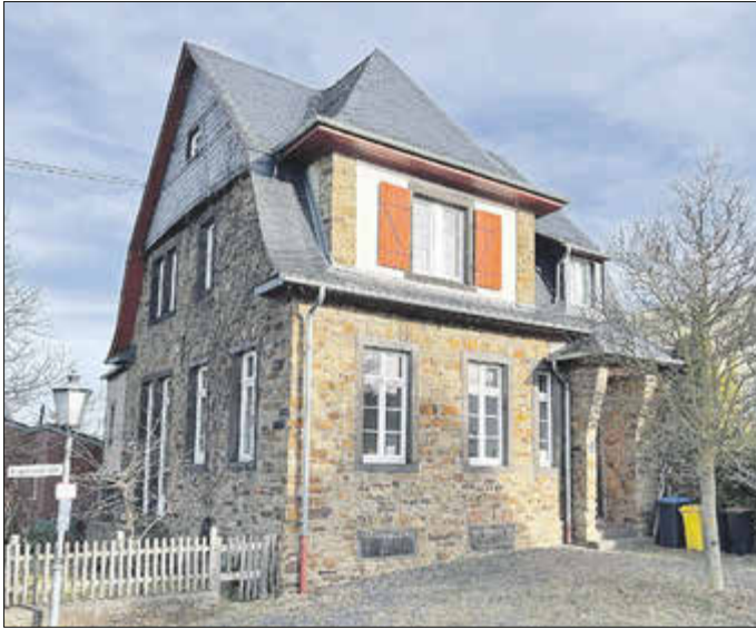
Ab 1877 verfügte Galenberg über das Schulgebäude, das später als Tagungsraum der Gemeinde diente.

Auch der Kindergarten war dort beheimatet