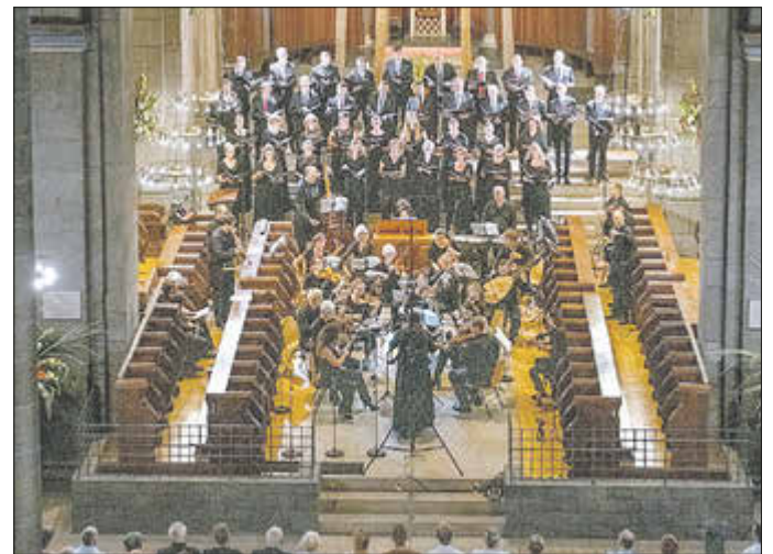
Die Abteikirche Maria Laach bietet ein unvergleichliches Konzert-Ambiente