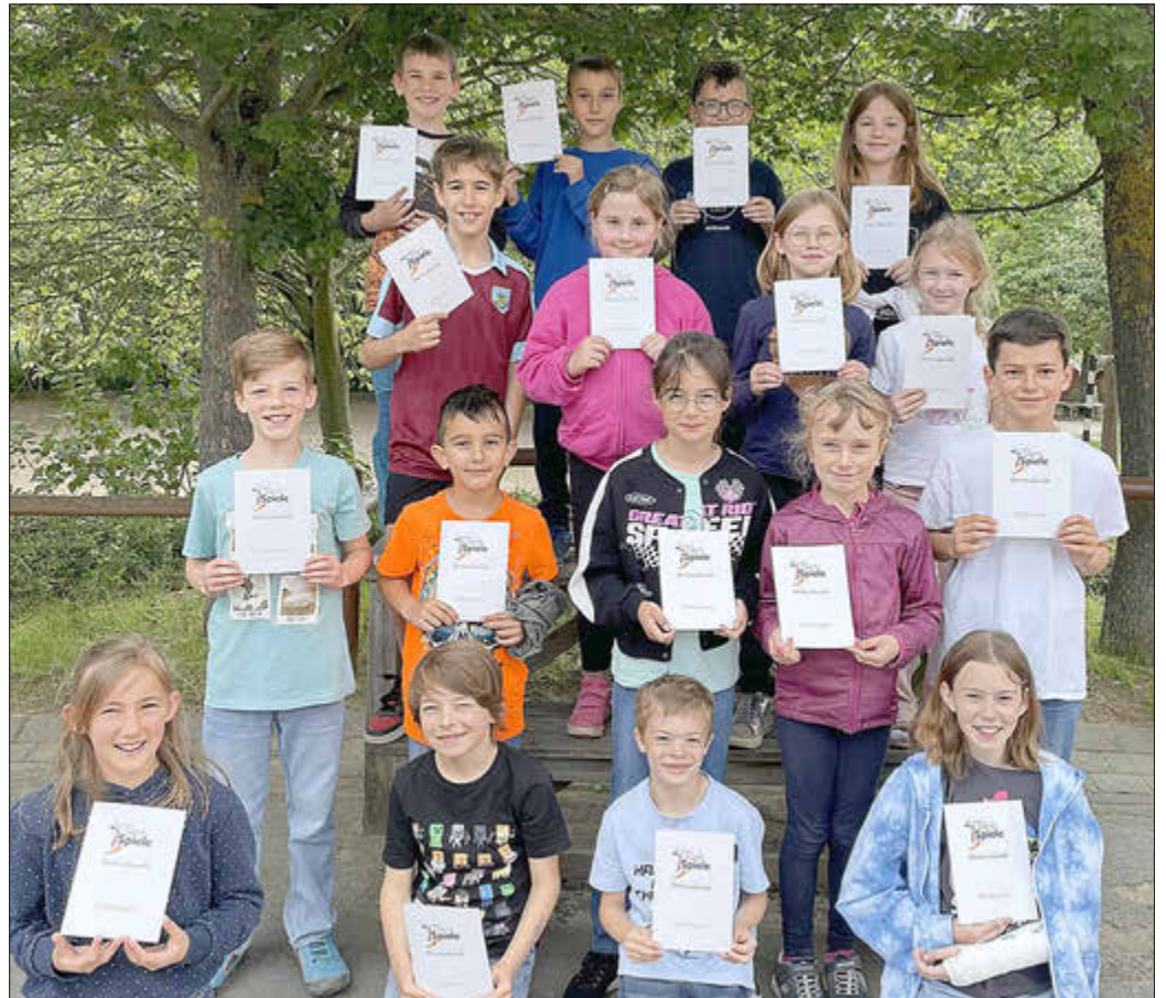
Stolz präsentieren die Kinder ihre Ehrenurkunden

NIEDERDÜRENBACH. Kurz vor den Pfingstferien zeigten die Schülerinnen und Schüler der Grundschule am Maar ihr sportliches Können auf dem neu gestalteten Sportplatz in Niederdürenbach. Werfen, Springen, Sprinten und Ausdauerlauf sowie Geschicklichkeit standen auf dem Tagesplan. Bei sonnigem Wetter waren alle motiviert und zeigten ihre sportlichen Leistungen. Diese Woche wurden nun die Kinder mit einer Ehrenurkunde auf dem Schulhof vor der Schulgemeinschaft ausgezeichnet. Siegerurkunden und Teilnehmerurkunden fanden auch ihren Besitzer. Alle freuen sich schon auf das kommende Sportfest im nächsten Jahr.