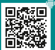
A.R.T. App für Android