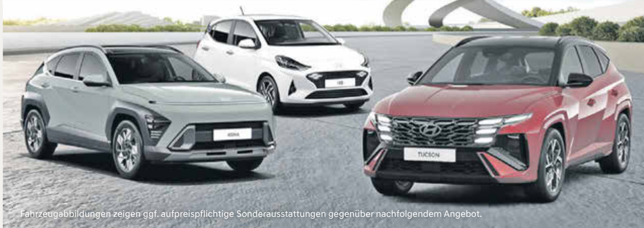
Fahrzeugabbildungen zeigen ggf. aufpreispflichtige Sonderausstattungen gegenüber nachfolgendem Angebot.

Jetzt noch Top-Angebote bis 30.06.2024 sichern