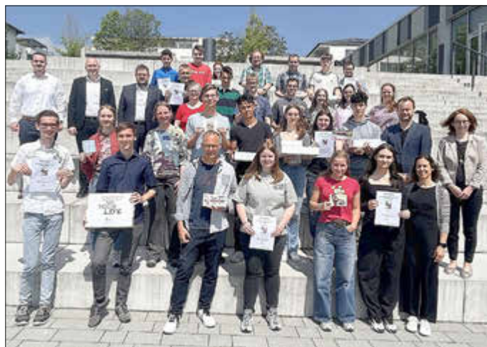
Die Teilnehmerinnen und Teilnehmer der Preisverleihung

In der Region Eifel-Trier nahmen in diesem Schuljahr 93 Klassen und Kurse mit insgesamt 2.031 Schülerinnen und Schülern von 18 Schulen am Wettbewerb teil, womit ein neuer Teilnehmerrekord in der Region aufgestellt wurde. Für die nächste Wettbewerbsrunde können sich die Schulen der Region wieder mit Beginn des neuen Schuljahres bei der regionalen Wettbewerbsleiterin Nadine Sonnenhögener (n.sonnen@st-willi.de) anmelden.