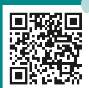
A.R.T. App für iPhone

Gerne informiert Sie auch das Service-Telefon unter 0651 9491 414