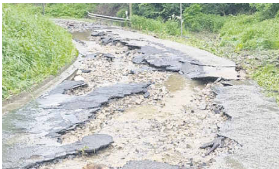
Diese Schäden an der Kreisstraße 7 bei Udelfangen sind durch das Unwetter an Pfingsten entstanden.

Der Landkreis Trier-Saarburg setzt derzeit Schritt für Schritt das Radverkehrs-