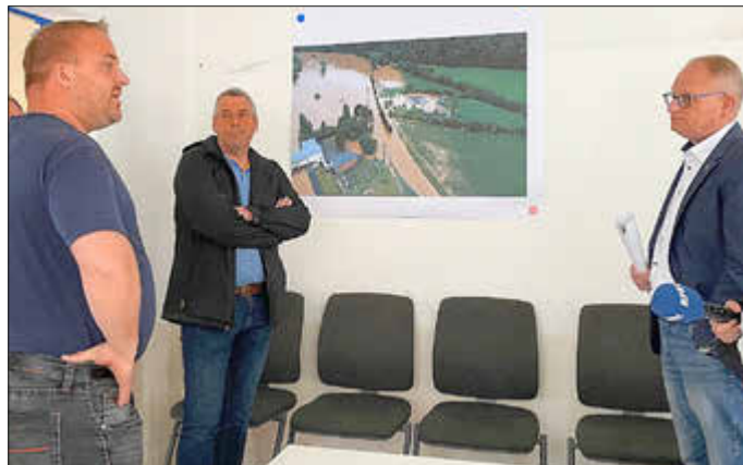
Spuren des Jahrhunderthochwassers sind immer noch zu sehen.

Im Rahmen einer Ortsbegehung informierten sich Mitglieder der Versammlung des Zweckverbands Internationales Abwasserklärwerk Rosport-Mompach/Trier-Land über den aktuellen Stand des Wiederaufbaus. „Um die Anlage sicherer vor möglichen Hochwasserschäden zu machen, haben wir z.B. die kritischen Einrichtungen wie die Schaltanlage in höher gelegene Gebäudeteile umgesiedelt. Demnächst werden wir auch die überflutete Trafostation auf einen höher gelegenen Geländeteil verlegen,“ erläutert Abwassermeister Axel Grölinger.