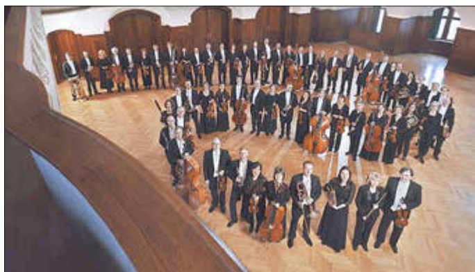
Die Musiker und Musikerinnen der „Jenaer Philharmonie“ eröffnen das diesjährige Stadtfest.