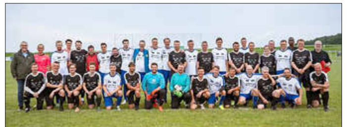
Die beiden Teams, Wirtschaft in schwarz und Presse in weiß-blau

Wie jedes Jahr kommen die Spendenerlöse des Spieles dem Gesundheitsprojekt zugute. Dieses Mal kamen durch Spenden (8.250 EUR) und Tombolaerlöse (856 EUR) insgesamt 9.106 EUR zusammen. Das ist die höchste Summe seit 2013, die wieder ein sehr guter Grundstein ist, um aktuell Kinder an zehn Grundschulen im Burgenlandkreis und Halle für Gesundheit zu sensibilisieren und zu stärken.