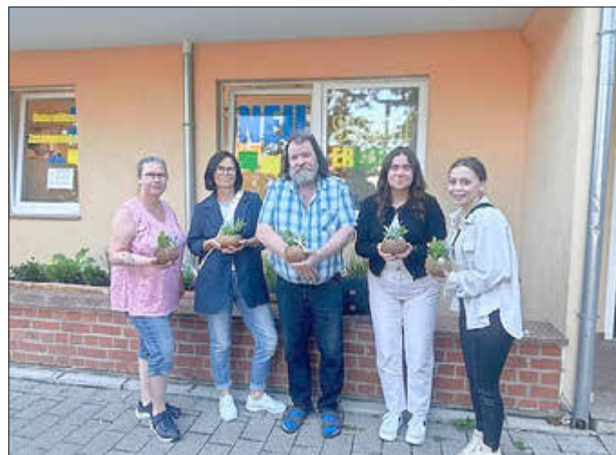
Das Neustadt-Gremium hat sich Ende Mai gegründet.

Mit dem Projekt „Draußenort Neustadtpark“ hat sich zum 28. Mai das Neustadt-Gremium gegründet. Vier Frauen und ein Mann im Alter zwischen 17 und 70 Jahren werden künftig gemeinsam mit dem Amt für Sozialraumentwicklung die Stimmen aus der Weißenfelser Neustadt in kommunale Gestaltungsprozesse einbringen. Im Sinne eines Quartiermanagements-Ansatzes wird das Gremium stellvertretend für die Bewohnerinnen und Bewohner des Stadtteils die Interessen der Bürgerschaft vertreten – mit Bewusstsein für die Probleme des Quartiers, aber auch mit Herz für die Menschen, die in der Neustadt leben. Über die E-Mail-Adresse stadtteilbuero@weissenfels.de oder über das Neustadtbüro können die Gremien-Mitglieder erreicht werden.