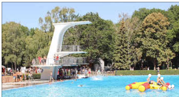
Freibad Weißenfels

In Weißenfels ist am 30. Mai 2024 die Freibadsaison gestartet. Das Bad im Kastanienweg 1 wartet mit einigen Neuerungen auf. So wurden die Öffnungszeiten wochentags um zwei Stunden erweitert. Das Freibad ist nun täglich von 10 bis 20 Uhr geöffnet. Die Eintrittspreise bleiben im Vergleich zum Vorjahr gleich (4 Euro Erwachsene/ 2,50 Euro Kind/ 11,50 Euro Familie/ Kinder bis 3 Jahre kostenfrei). Saisonkarten sind ab sofort in der Touristinformation am Markt 3 erhältlich (130 Euro Erwachsene/ 75 Euro Kind/ 250 Euro Familie). Mit dem Erwerb erhalten Badegäste