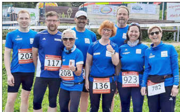
Die LG'ler vor dem Start in Vettelhoven