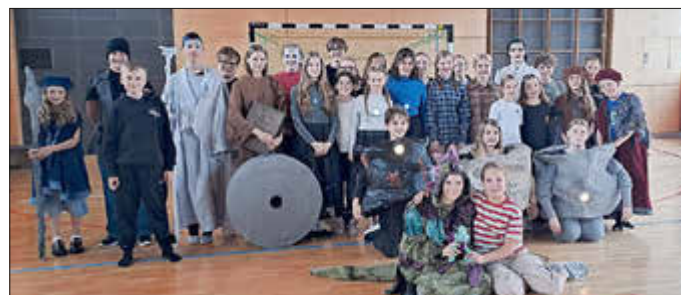
Das Ende eines ereignisreichen Probenabtags der jungen Akteure der PMS

Pellenz Musical School bereitet sich auf ihre Auftritte vor