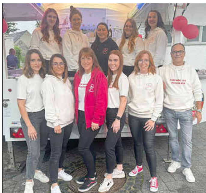
Vorstand der KG Wohlgemut

Am vergangenen Samstag, den 22. Juni 2024, feierte die Karnevalsgesellschaft Wohlgemut ihr drittes Sommerfest. Trotz des anfänglichen Regens erwies sich die Veranstaltung als großer Erfolg. Der Regen konnte die gute Laune der Besucher*innen nicht trüben und