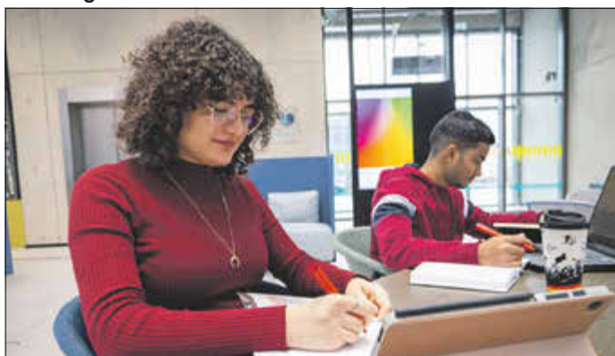
Auf dem Weg in eine rosige Zukunft: Studierende beim Lernen.

Ein neuer Studiengang bildet die Ingenieurinnen und Ingenieure von morgen aus