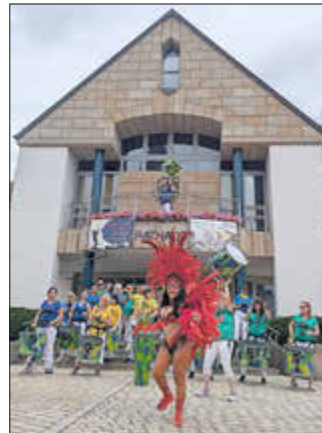
BQE Samba Bamberg

Wir hoffen, dass jeder auf seine Kosten gekommen ist und können zusammenfassen, dass es eine sehr schöne Veranstaltung war. Das Dankeschön gilt vor allem den Akteure, die diesen Tag möglich gemacht haben.