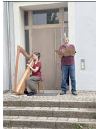
Wortstränge & Harfenklänge