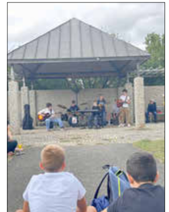
Schulband der RSH