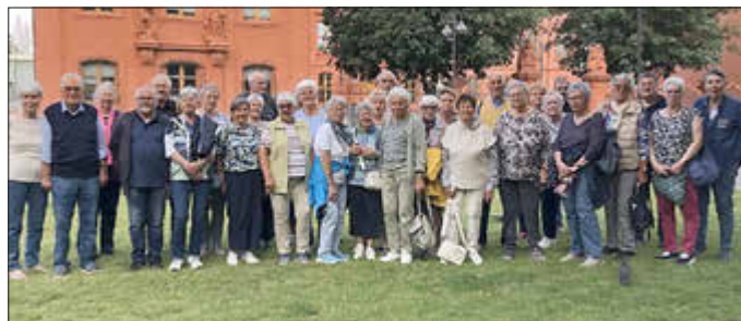
Senioren von Gemünden zum Besuch im Mainzer Landtag

Mit Livemusik, guter Laune und einigen Überraschungen werden wir unsere Gäste empfangen. Wir bieten beliebte fleischige Hauptpeisen und schmackhafte, in eigener Kreation erstellten Salate.