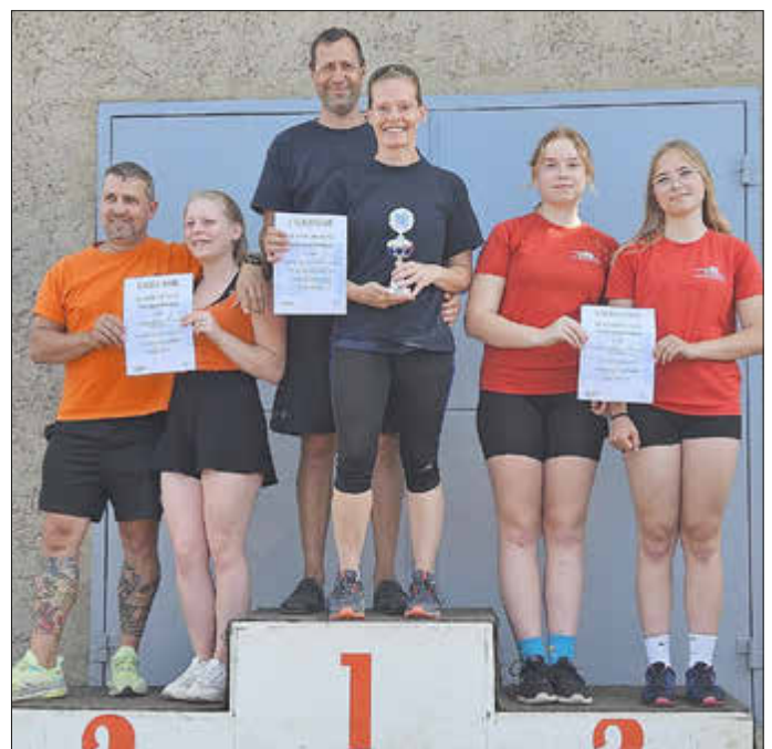
Single Mix Biathlonpokal. Forst (Lausitz) siegt vor Sömmerda und Erfurt