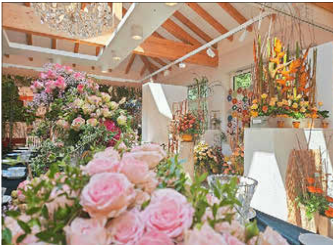
Schnittrosenschau 2024 „Mit der Rose um die Welt“

Ein im wahrsten Sinne des Wortes „heißes“ Festwochenende liegt hinter der Rosenstadt Forst (Lausitz). Rund 11.600 Gäste besuchten bei durchweg hohen Temperaturen die diesjährigen Rosengartenfesttage.