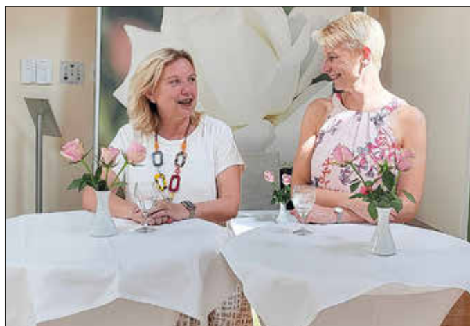
Pressegespräch im Rosengarten