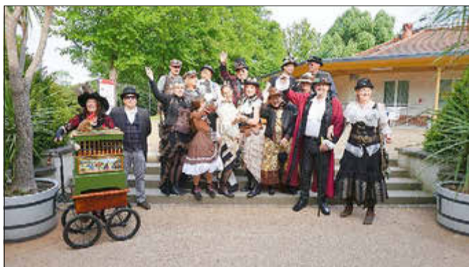
Steampunker im Ostdeutschen Rosengarten

Am 7. September 2024 ist es wieder so weit: Das STEAMROSE-Festival geht in die 3. Runde.