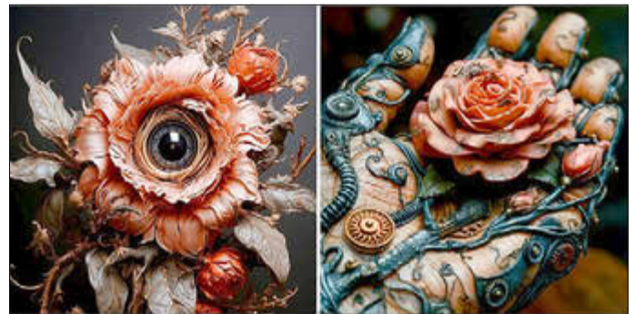
KI-Kunstwerke von Prinz Rupl

Anlässlich des Steamrose-Festivals am 7. September 2024 auf der Wehrinsel des Ostdeutschen Rosengartens werden Werke des Künstlers Prinz Rupl ausgestellt. Prinz Rupl, auch bekannt als Ruprecht Frieling, erlangte als erster deutscher Künstler durch von künstlicher Intelligenz (KI) erschaffene Werke internationale Anerkennung. Seine Kunstwerke sind in Galerien und Museen in Deutschland, den Niederlanden, Spanien und Großbritannien zu sehen.