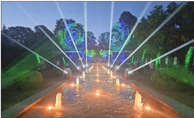
Romantiknacht im Rosenpark