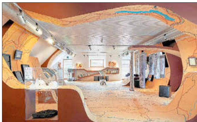
Blick ins Archiv verschwundener Orte