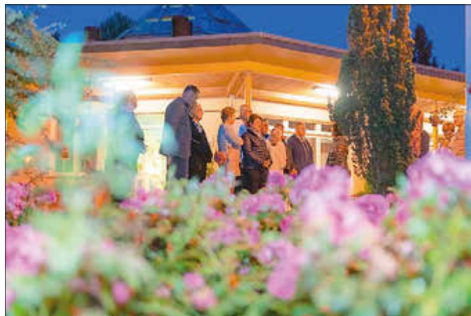
Romantische Nachtführung

Erleben Sie den Park einmal ganz anders! Genießen Sie zu Beginn ein Rosen-Menü im Restaurant „Rosenflair“. Anschließend werden Sie in das nächtliche Flair des Gartens eingeladen, begleitet von Rosen im Laternenlicht.