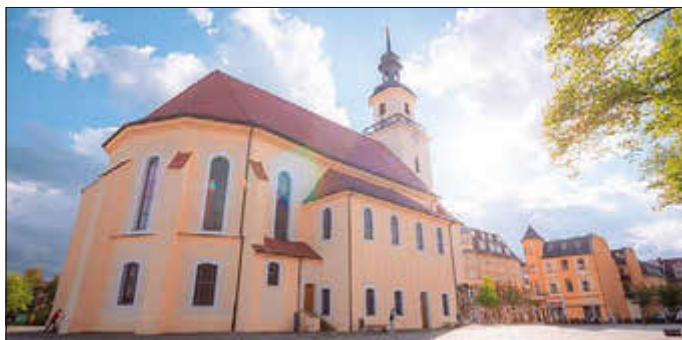
Stadtkirche St. Nikolai

15. September 2024 um 16 Uhr in der Stadtkirche St. Nikolai Eintritt frei, um Kollekte wird gebeten