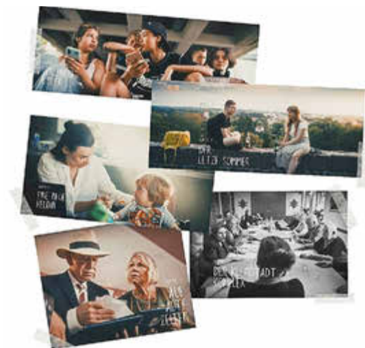
Ein Feuerwerk für die Kleinstadt Collage: LUSATIA FILM

Erstmals nach über 30 Jahren lädt der Ostdeutsche Rosengarten wieder zu einem Freiluftkino ein. Unterm Sternenhimmel wird erstmalig der Lausitzer Publikumserfolg „Ein Feuerwerk für die Kleinstadt“ vorgeführt. Das Filmteam und Darstellenden, u.a. Regie, Kamera und Hauptdarstellende werden mit vor Ort sein. An den Tagen danach wird der Film jeweils abends in der Villa Digitalkultur gezeigt.