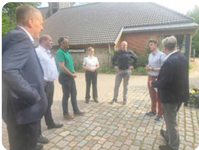
Die anwesenden Personen streiten sich um den hühnerdichten Zaun