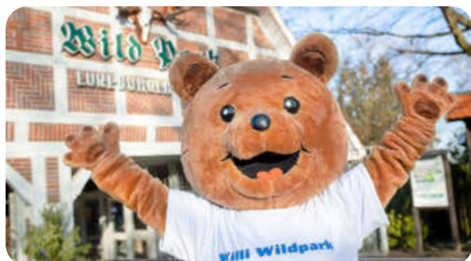
Willi Wildpark freut sich auf das Kinderfest am 4. August.

Willi Wildpark freut sich auf ein buntes und fröhliches Programm für die kleinen Besucher in der Zeit von 12.00 bis 17.00 Uhr. Info unter: www.wild-park.de