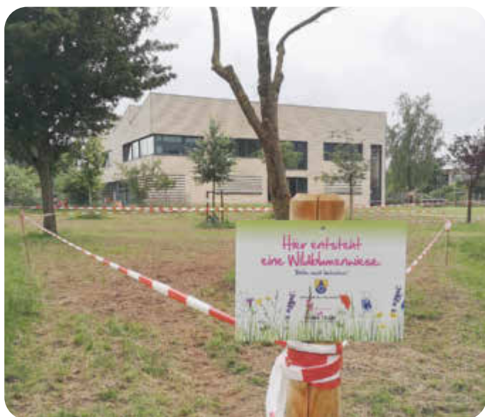
Wildblumenwiesen Ansaat hinter dem Mehrgenerationenhaus Courage

Die Friedhofswiese an der Lutherkirche: dort, wo vorher der Holzpavillon/ Blumenladen stand, haben wir am 4. Mai 2024 angesät. Warum tut sich dort so wenig? Ist es das kalte nasse Frühjahr oder haben Vögel das Saatgut aufgepickt? Wir wissen es nicht, aber mit Geduld und eventueller Nachsaat wird es schon klappen. Die von uns gesetzten Fingerhüte und Blumenzwiebeln aus unserer Blumenzwiebelaktion werden bestimmt im nächsten Jahr erblühen! Die Wiese hinter dem Mehrgenerationenhaus Courage wurde von uns am 1. Juni 2024 angesät. Auch dort werden wir bei Bedarf nachsäen.