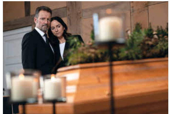
Die liebsten entlasten und die eigene Wünsche festlegen, mit einem Bestattungsvorsorgevertrag.