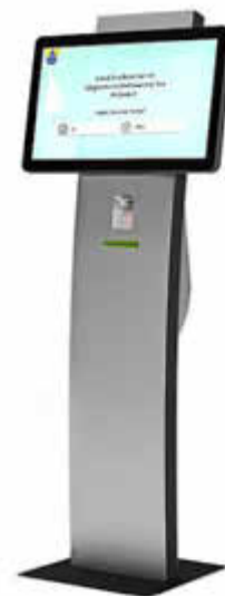
Self Service Terminal in der Gemeinde Neu Wulmstorf