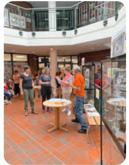
Abschlussveranstaltung Stadtradeln 2024

Besonders erwähnenswert ist die Teilnahme von drei Kindergärten und dem Team LeA, bei dem auch Bewohner mitradelten. Ein Dank auch die Sponsoren Zum Dorfkrug Landhof, dem Fahrradhaus Hausschild, dem Melkus, Hof Bartels und dem Obsthof Viets sowie Sonjas Eisladen.