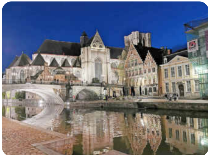
Gent bei Nacht