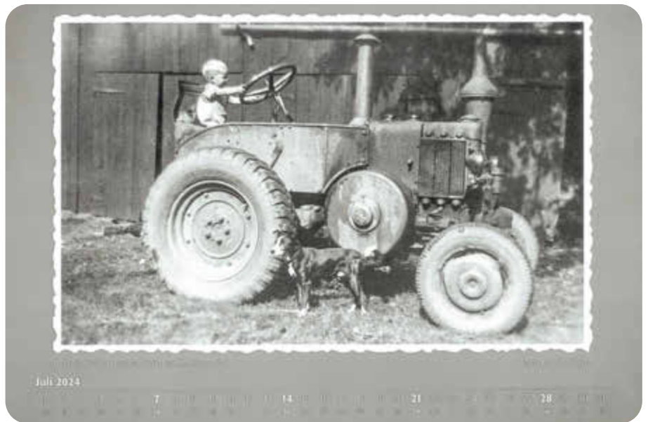
Kalenderblatt Juli 2024