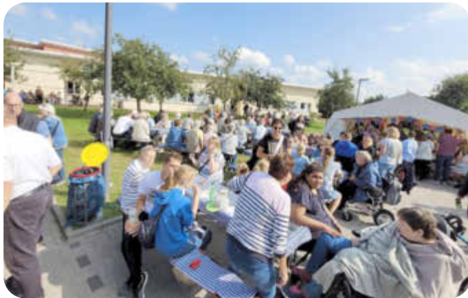
Beste Stimmung beim LeA Summer-Sound 2023

Am 17. August 2024 von 14:00 bis 19:00 Uhr verwandelt sich das LeA-Gelände rund um die Laurens-Spethmann-Häuser und die Kita Krümelkiste wieder in eine große Summer-Sound Festlandschaft. Bürger*innen aus Neu Wulmstorf und Umgebung sind herzlich eingeladen, einen unvergesslichen Tag voller Freude, Genuss und Unterhaltung zu erleben.