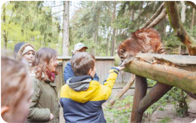
Hautnah erleben die Kinder die Tierwelt im Wildpark.

Springt jemand so weit wie der Schneeleopard? Und wer hat den besten Riecher? Hier gilt es, Geschicklichkeit unter Beweis zu stellen und man lernt obendrein jede Menge über die besonderen Fähigkeiten der Tiere.