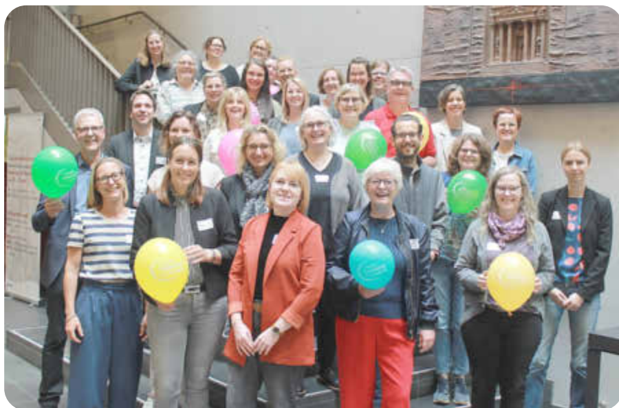
Gruppenfoto Lokale Bündnisse Hamm

Alle arbeiten zusammen nach ihren Möglichkeiten an dem Ziel, die Lebens- und Arbeitsbedingungen für Familien durch bedarfsorientierte Projekte zu verbessern. Seit 2004 besteht die Bundesinitiative „Lokale Bündnisse für Familie“,