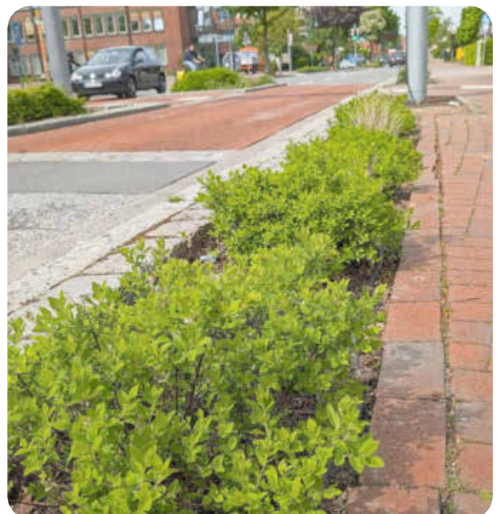
Gepflegte Rabatten in der Bahnhofstraße

Zusätzlich zur Pflege und Unkrautentfernung der Pflanzflächen umfasst der Auftrag auch die Reinigung der angrenzenden Wege- und Straßenflächen in einer Breite von 30 cm. Geplant sind insgesamt drei Durchgänge pro Jahr. Die Pflege der Rabatten in der Bahnhofstraße bleibt jedoch weiterhin in der Verantwortung des Baubetriebshofes.