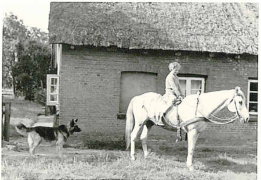
Sommer in Dearstorf