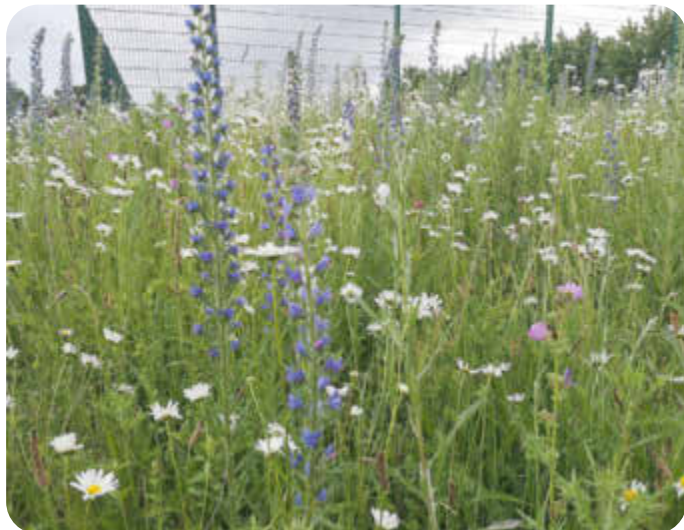
Wildblumenwiese an der Sportanlage des TSV in Elstorf im 2. Jahr