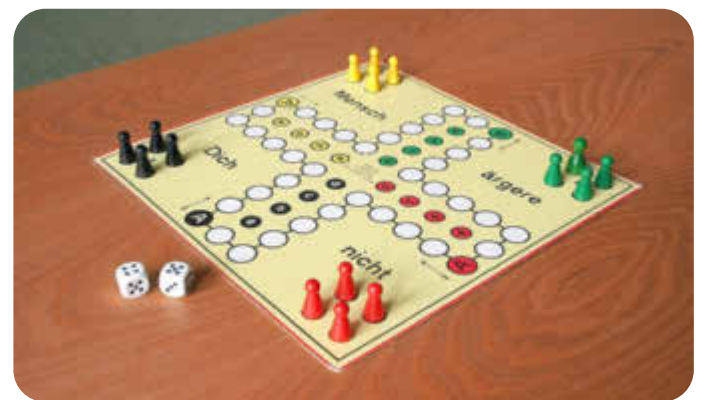
Mensch ärgere dich nicht

Auch der beliebte Spielenachmittag der Heidesiedler steht in den Sommerferien auf dem Programm. Gespielt wird immer samstags von 14.30 bis 17.00 Uhr. Ein großes Angebot an Gesellschaftsspielen, Kartenspielen usw. steht dafür vor Ort zur Verfügung und wird meistens abgerundet mit Kaffee, Keksen und Kuchen – also die perfekte Mischung für einen geselligen Nachmittag mit Familie, Freunden und/oder Nachbarn.