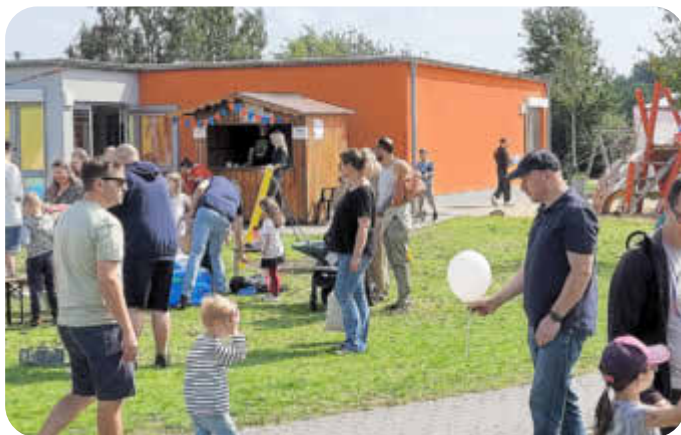
Spiel und Spaß für Kids