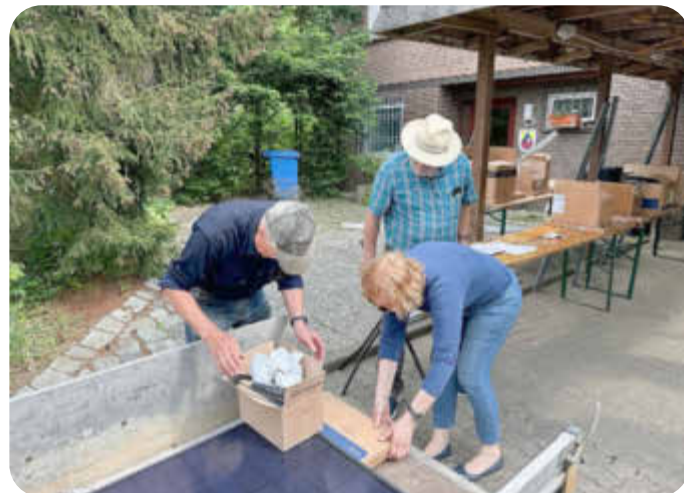
Ausgabe der PV-Module und des Montagematerials (Vereinsheim Heidesiedler)

Das Klimagespräch zum Thema Balkonkraftwerke und Bürger-Solarkraftwerke Rosengarten eG am 8. April verlief sehr erfolgreich. Die SOLARINITIATIVE erfreute nicht nur das überragend große Interesse an dieser Informationsveranstaltung, sondern auch die Vielzahl an spontanen Anmeldungen, eine Balkonkraftwerk-Anlage möglichst bald selbst zu betreiben.