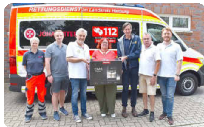
Die Mitarbeitenden der Johanniter-Rettungswache in Elstorf freuen sich über die neue Kaffeemaschine und das harmonische Miteinander beim Grillfest

Mit der Anerkennung als Lehrrettungswache werden hier Rettungsassistenten sowie Notfallsanitäter ausgebildet.