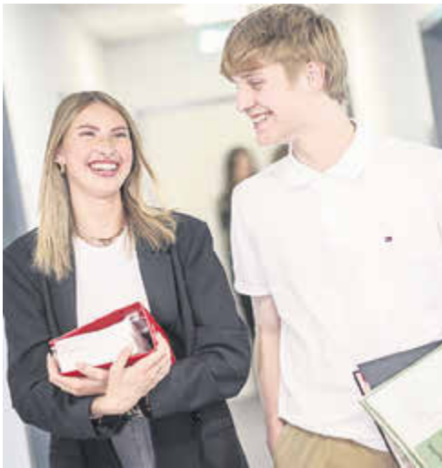
Ausbildung zum Verwaltungswirt (m/w/d) 2. Einstiegsamt