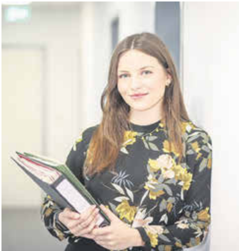
Duales Studium - Verwaltung (m/w/d) 3. Einstiegsamt