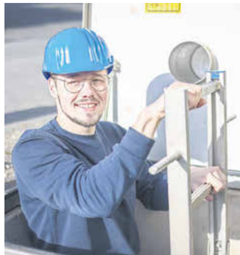
Umwelttechnologe für Wasserversorgung (m/w/d)