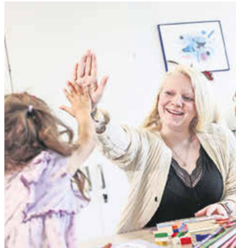
Duales Studium - Soziale Arbeit (m/w/d)