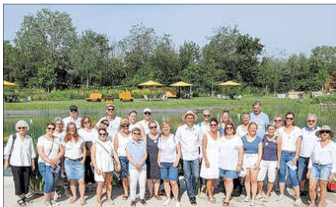
Pausenchor bei der Landesgartenschau in Kirchheim

Für den Pausenchor gestalteten sich die Sommerkonzerte als wettertechnisches Wechselbad: