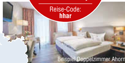
Beispiel Doppelzimmer Ahorn