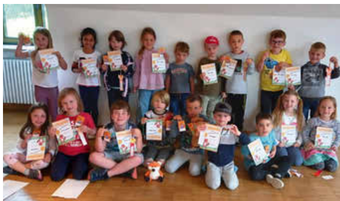
Die frisch gekürten Lesefüchse zeigen stolz ihre Urkunden und Lesefuchs-Ausweise.

Die Bücherei befindet sich im Pfarrheim und ist immer am Sonntag von 10 bis 11.30 Uhr geöffnet. Die Ausleihe ist kostenlos.