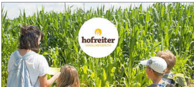
Maislabyrinth Hofreiter Lochhausen

Die Vorstandschaft vom Gartenbauverein Langweid