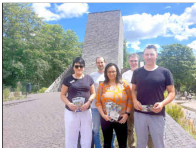
Die Verantwortlichen des Baumkronenweges und Besucherzentrums freuen sich, das Kombiticket ihren Gästen anbieten zu können.