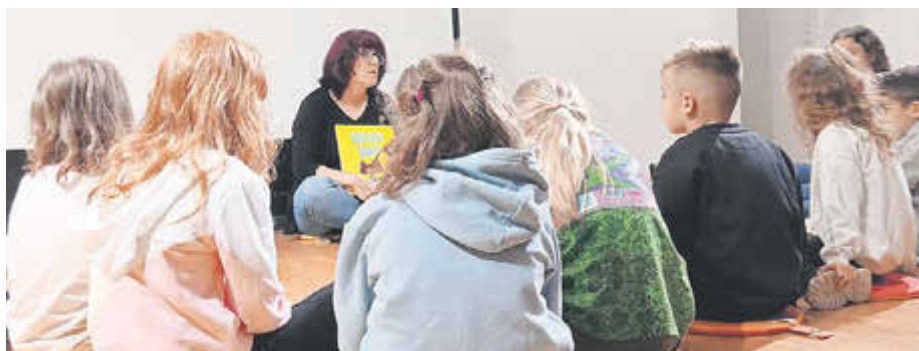
Die Kinder bekommen das Bilderbuch „Sophias Sorge“ präsentiert.