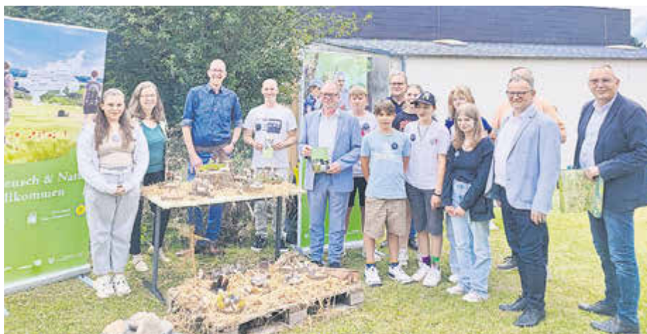
Die Schüler:innen und Kooperationspartner:innen nach der Unterzeichnung der Vereinbarung.

Gemeinsam mit Naturpark-Referentinnen und Referenten, sowie außerschulischen Kooperationspartnern beschäftigten sich die Schülerinnen und