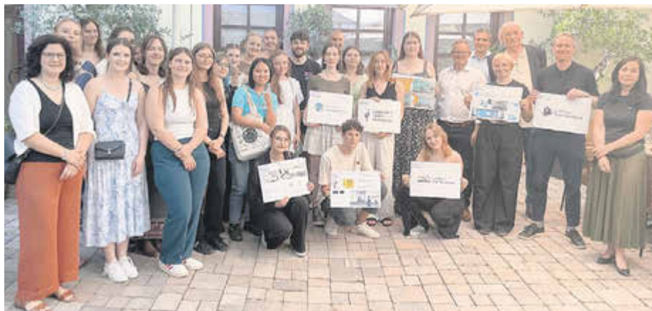
Die Studentinnen und Studenten bei der Preisverleihung