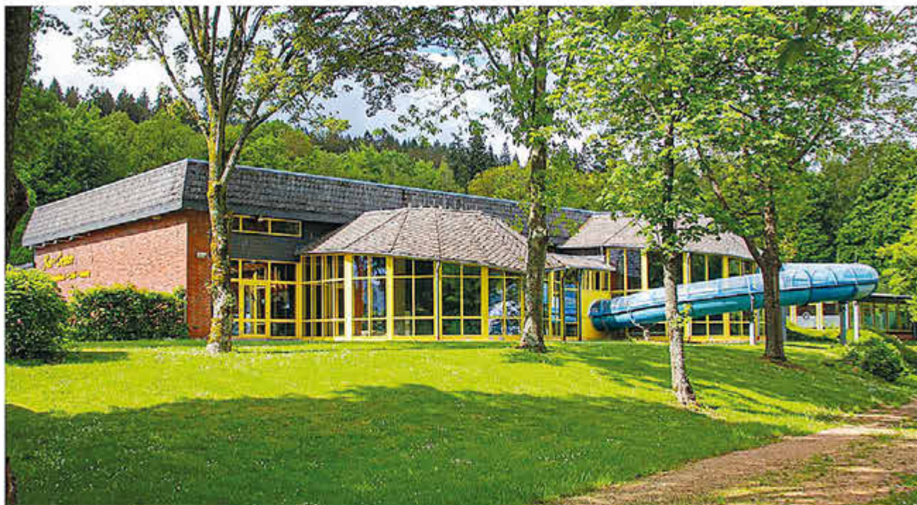
Im Kurcenter Freizeitbad Prüm kann wieder geschwommen und geplantscht werden.

190.000 Euro Förderung, um das Waldschwimmbad wiederherzustellen. Seit Mai 2022 können Besucherinnen und Besucher hier wieder ihre Freizeit verbringen und auch für den Tourismus der Region hat die Badeanstalt eine wichtige Bedeutung. Auch das Freizeitbad konnte im Januar 2023 wiedereröffnen. Badegäste aus der ganzen Region haben