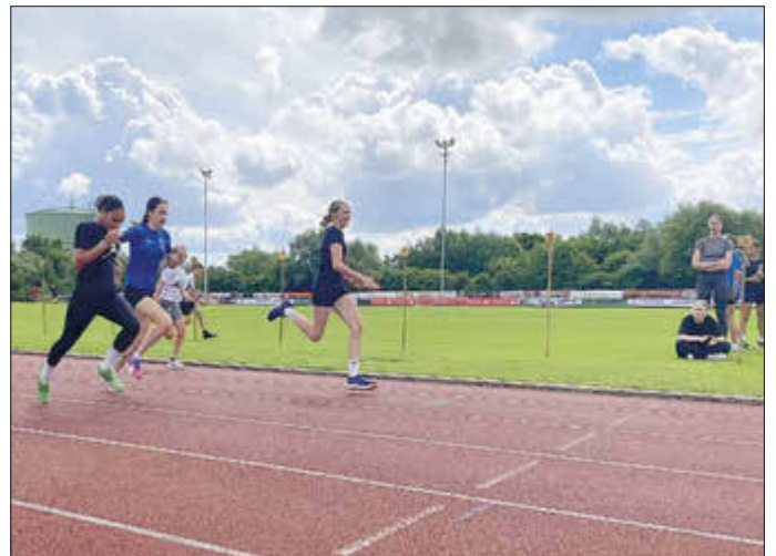
Die Teilnehmer zeigten viel Ehrgeiz bei den Wettkämpfen.