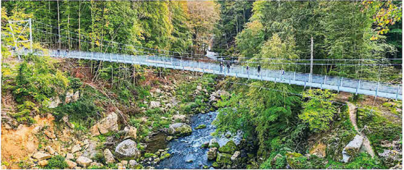
Die neue Hängebrücke über den „Irreler Wasserfällen“ ist nicht nur bei Wanderern ein beliebtes Ausflugsziel.

aus und war deshalb die hochwasserresilientere Alternative.