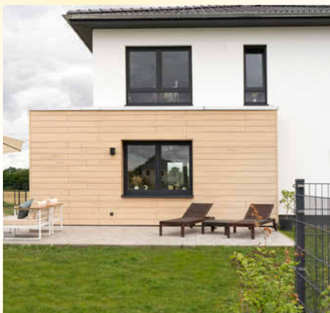
Fassaden schützen und schmücken das Zuhause gleichermaßen. Für ein naturnahes Bauen eignen sich moderne Holzverbundwerkstoffe.

In der Natur folgt alles einem Kreislauf. Das gilt ebenso für das nachhaltige Bauen, bei dem vorausschauend auch bereits an eine spätere Wiederverwendung der Materialien gedacht wird. Dazu können beispielsweise die Fassadenpaneele nach der Nutzungszeit in den Produktionskreislauf zurückgeführt und wiederverwendet werden. Unter www.megawood.com gibt es ausführliche Informationen dazu sowie zahlreiche Inspirationen für eine unverwechselbare Fassadengestaltung. Zu den Vorteilen zählen auch das vielfältige Zubehörprogramm sowie die einfache und schnelle Montage per Klick-System. Dabei werden die Fassadenpaneele einfach auf der ebenfalls recycelbaren Unterkonstruktion aus Edelstahl befestigt.