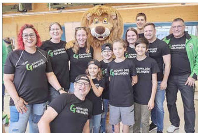
Die Grünholder-Jugend auf der Guschu Open auf der Olympiaschießanlage