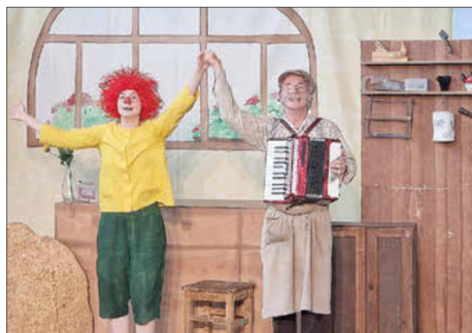
Pumuckl und Meister Eder von der Schaubühne

„Hurra, der Pumuckl ist wieder da!“ hieß es am 11. Juli in der KITA St. Martin Gablingen. Schon bei der Vorbereitung der Bühne haben die Schauspieler viele neugierige Blicke geerntet. Als es dann endlich losging, waren die kleinen Zuschauer deutlich aufgeregter, als die erfahrenen Schauspieler. Die Kindergartenkinder hatten schon seit Tagen auf die Aufführung der Schaubühne aus Augsburg hingefiebert. Die Aula war mit den Kindergartenkindern aus den 5 Kindergartengruppen gut gefüllt. Mit einem lustigen und kurzweiligen Stück haben die Schauspieler den Kindern eine Episode von Meister Eder und seinem Pumuckl vorgeführt. Mit viel Freude und Enthusiasmus wurden die Kinder in das Stück mit einbezogen und haben begeistert mitgefiebert, welchen Schabernack Pumuckl wieder ausgeheckt hat. Nach einer guten Stunde Spielzeit war das lustige Stück zu Ende und die Kinder sind mit großer Begeisterung für die Geschichten rund um den rothaarigen Kobold wieder in ihre Gruppen zurück gekehrt. Die Vorführung wurde zu 100 % vom Elternbeirat der KITA finanziert. Dank der Einnahmen aus Kuchenverkäufen und dem halbjährlichen Flohmarkt konnte dieses tolle Erlebnis für die Kindergartenkinder ermöglicht werden.