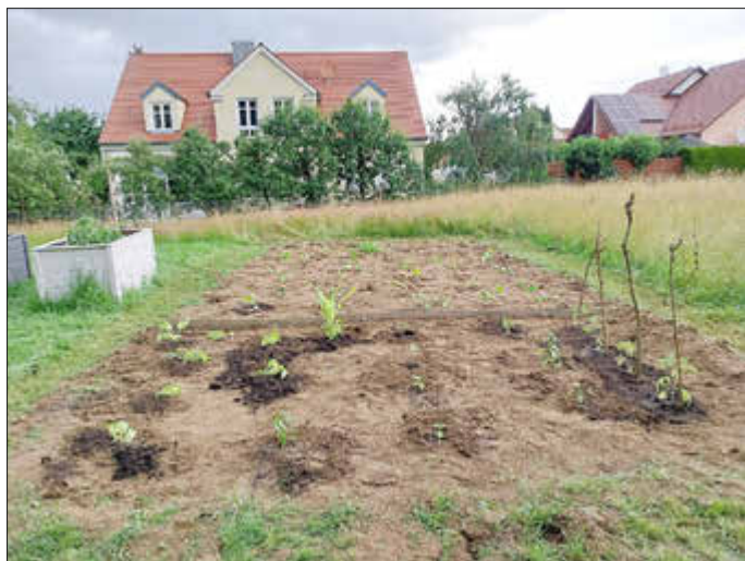
Kindergruppe des OGV Lützelburg

Wir freuen uns auf eine gute Ernte und bedanken uns bei den fleißigen Helfern!