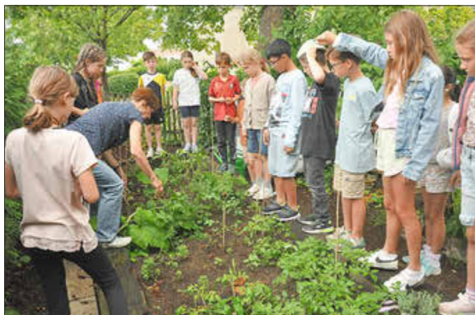
Wer kennt diese Pflanzen?