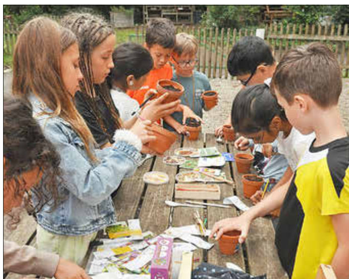
Alle säen ihr Gemüse ein!