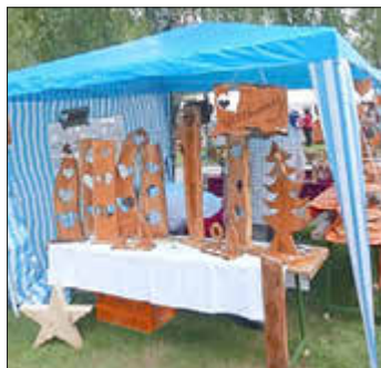
Aussteller bieten ihre Ware an.