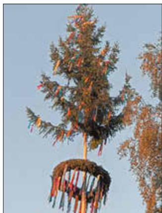
Die Kirmesjugend stellt am Freitag den Kirmesbaum.

In diesem Jahr feiern wir unsere Kirmes, vom 23.08. bis zum 26.08.2024 unter dem Motto: „Natur erleben“ Zur Gestaltung des Kirmesprogramms haben wir Gäste eingeladen und wie immer sind natürlich unsere Ortsvereine mit dabei.