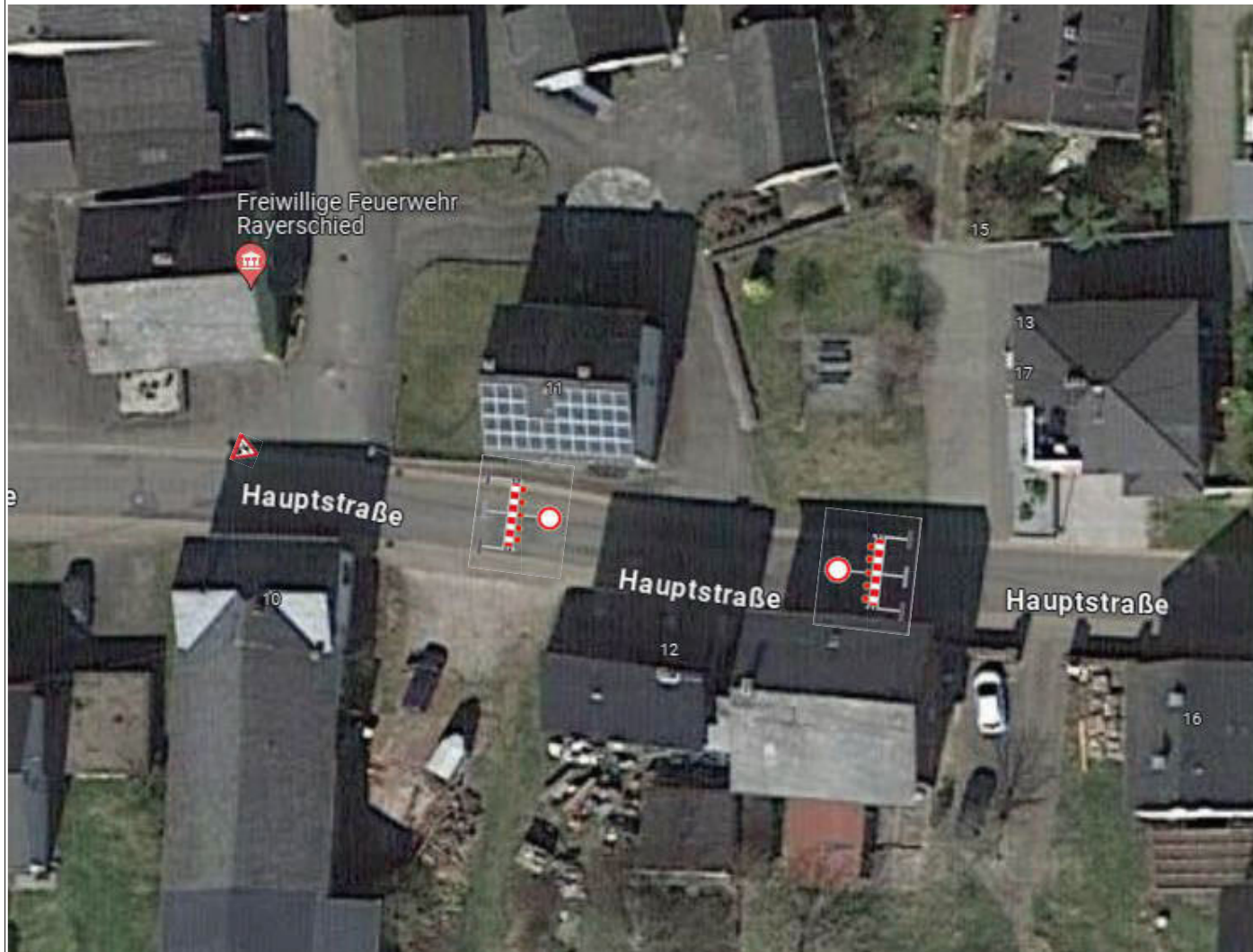
Anlage VI Vollsperrung Hauptstraße (L223) vor Hausnummer 12 in Rayerschied

Verbandsgemeindeverwaltung Simmern-Rheinböllen -Straßenverkehrsbehörde-