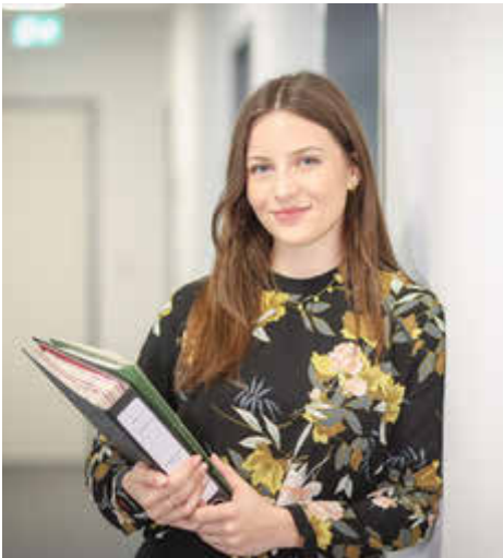
Duales Studium - Verwaltung (m/w/d) 3. Einstiegsamt