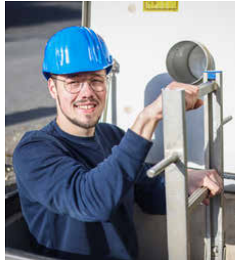
Umwelttechnologie für Wasserversorgung (m/w/d)