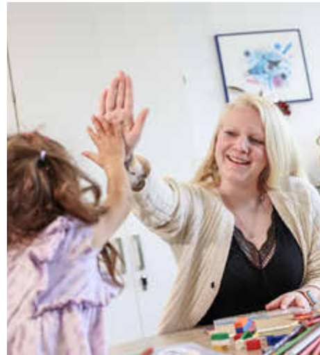
Duales Studium - Soziale Arbeit (m/w/d)