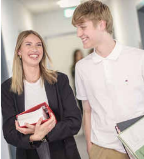
Ausbildung zum Verwaltungswirt (m/w/d) 2. Einstiegsamt