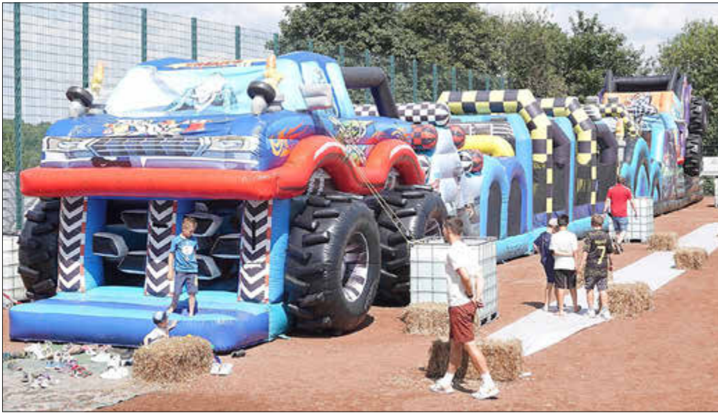
Hingucker und Anziehungspunkt beim Familienfest war eine übergroße Hüpfburg-Anlage.

LANTERSHOFEN. TW. Das 50-jährige Bestehen der Gemeinde Grafschaft wird in diesem Jahr gefeiert, und zwar dezentral. Alle Ortsbezirke sind aufgerufen, Feste und Feiern zu organisieren. In Lantersho-