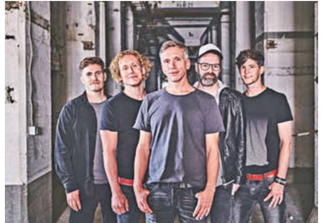
Sie sind auch im Kurpark dabei: „Kasalla“

BAD NEUENAH-RHRWEILER. Gute Laune, Sommerfeeling und ein fünfstündiges Programm voller Kölner Karnevals-Größen erwarten die Fans des kölschen Lebensgefühls am Samstag, 10. August, im Kurpark Bad Neuenahr-Ahrweiler. Unter dem Motto „Typisch Kölsch“ lädt die Ahrtal und Bad Neuenahr-Ahrweiler Marketing GmbH in Kooperation mit dem Festausschuss Karneval Bad Neuenahr-Ahrweiler 1997 e.V. (FAK) zu einer Sommer-Kölsch-Party der Extraklasse ein.