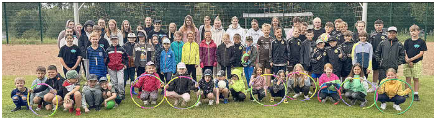
Schlechtes Wetter kann den Kids und Betreuern beim Sportcamp nichts anhaben

So gab es am letzten Tag nicht nur viel Applaus für das Gewinner-Team der Sportolympiade, die am Morgen stattfand, sondern auch für die ehrenamtlichen Helfer.