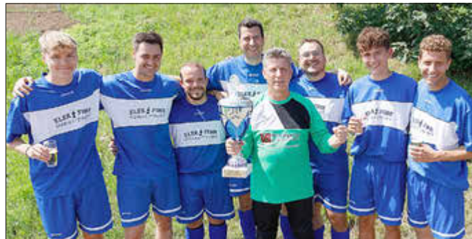
Der neue Birresdorfer Dorfmeister ist Birresdorf-Ost.