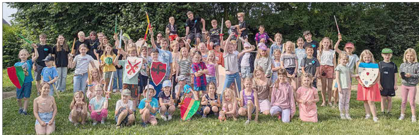
Mutige Burgfräulein und edle Ritter in Leimersdorf