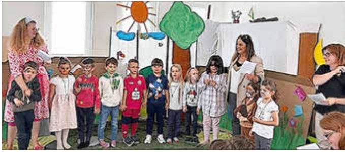
Dieser Abschied ist für die Kinder auch ein Neuanfang. Nach dem Kindergarten folgt der erste Schultag.