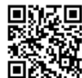
▲ Angebote melden

Reichen Sie gerne Ihre Betriebs-Infos und Angebote rund um die Themen Kulinarik, Wandern, Ausflüge, Gesundheit & Wellness bis zum 20. September 2024 bei uns ein. Relevant für das Winterprogramm sind alle Angebote im Zeitraum von November 2024 bis März 2025.