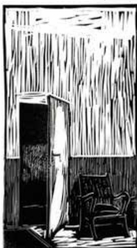
Pausensessel

Es lädt der Freundeskreis der Synagoge Zell zur Ausstellung ein