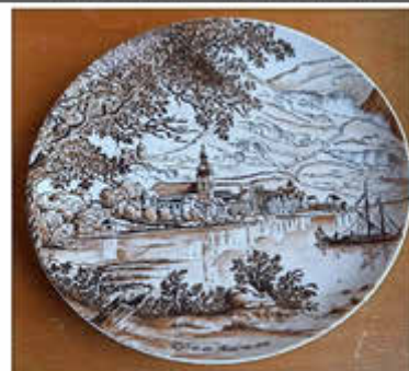
Wandteller Zell um 1840