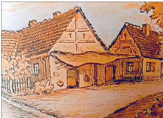
Alte Schmiede, Meisterberg