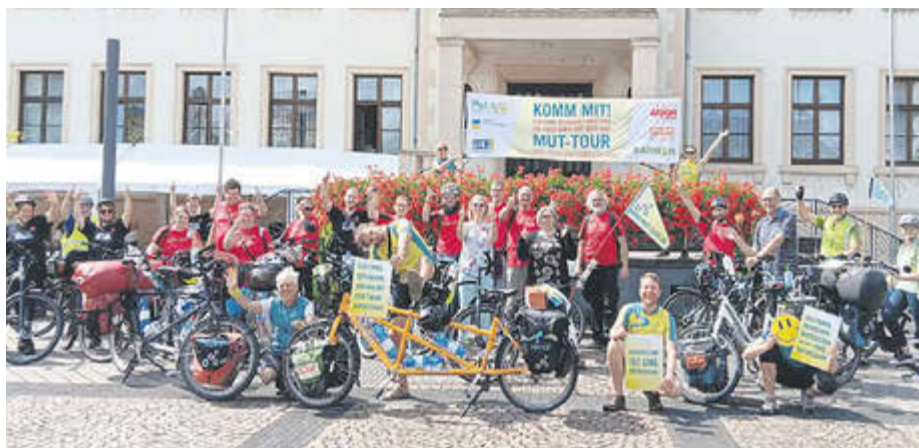
Die Radlerinnen und Radler haben sich zur Mitfahraktion in Konz getroffen.