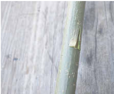
Die Teilnehmenden konnten selber einen Veredelungsschnitt probieren.