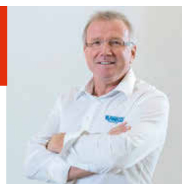
Plameco Fachberater H. Schmitz

Plameco Spanndecken Eifel-Mosel-Trier Zur Tuchbleich 17 54534 Großlittgen ☎ 06575-901 771