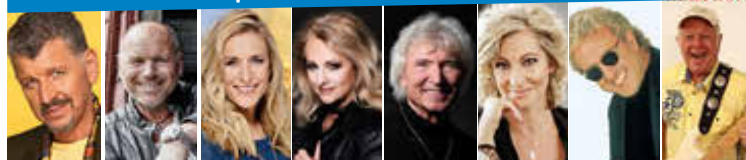
Semino Rossi, Olaf Henning, Stefanie Hertel, Nicole, Peter Orloff, Claudia Jung, Bernie Paul und Graham Bonney

Weitere Infos unter: www.schlager-kanaren.de