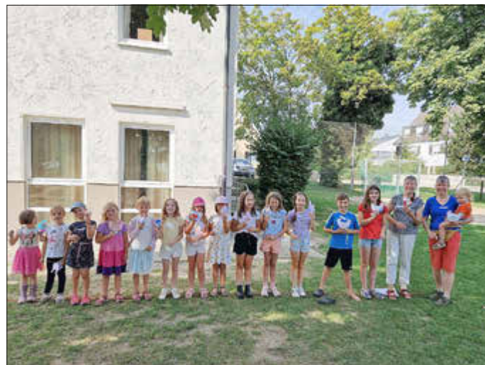
Stolze werden die Gackerhühner präsentiert

Vor den Ferien nahm der Trachtenverein an dem Projekt „Schule vereint“ der Grundschule Gablingen und des Kreisjugendrings Augsburg teil. Dort konnten wir vielen Kindern den traditionellen Tanz mit Spiel und Spaß beibringen.