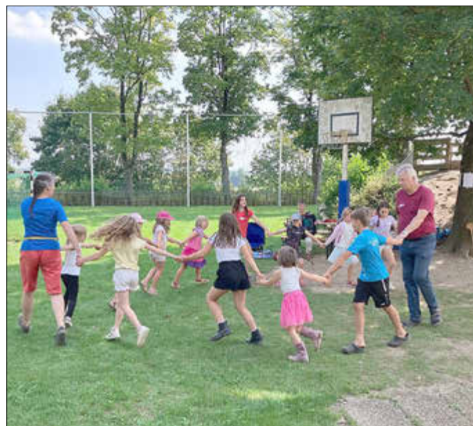
Das große Gerenne

Wir freuen uns darauf viele neuen Gesichter bei unserer ersten Tanzprobe am 19.09.2024 im Rathaus in Gablingen wieder zu sehen.