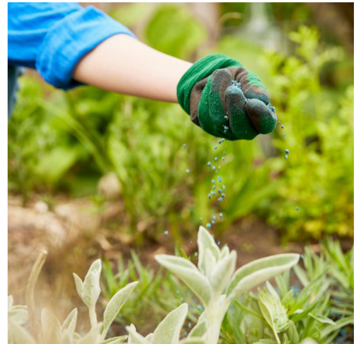
Ein Bio-Dünger mit vielen organischen Rohstoffen verhilft Pflanzen zu einem gesunden Wachstum und schont gleichzeitig die Umwelt.

dazu mehr Details und viele weitere Tipps für ein erfolgreiches Gärtnern. Dieser Bio-Dünger enthält sowohl mineralische als auch organische Rohstoffe. Letztere sorgen dafür, dass die Humusbildung gefördert wird und der Dünger besonders schnell und effizient wirkt. Der enthaltene hohe Kalium-Anteil stärkt zudem die Zellwände, sodass die Pflanzen besser vor anhaltender Hitze und Trockenheit im Sommer geschützt sind, und sorgt für eine sichere Ernte. Noch ein Tipp: Auch für die Neupflanzung ist der Bio-Dünger gut geeignet, dazu die blauen Perlen einfach mit in das Pflanzloch geben.