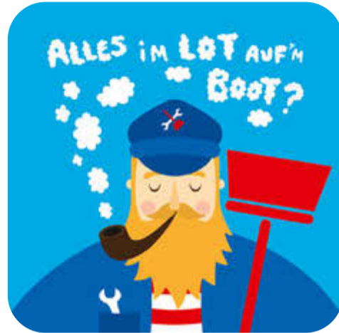
Klarschiff-MV der digitale Mängel- und Ideenmelder S. 3