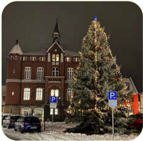
Weihnachtsbaum für den Laager Marktplatz gesucht! S. 2

DES AMTES LAAGE, DER STADT LAAGE SOWIE DER GEMEINDEN