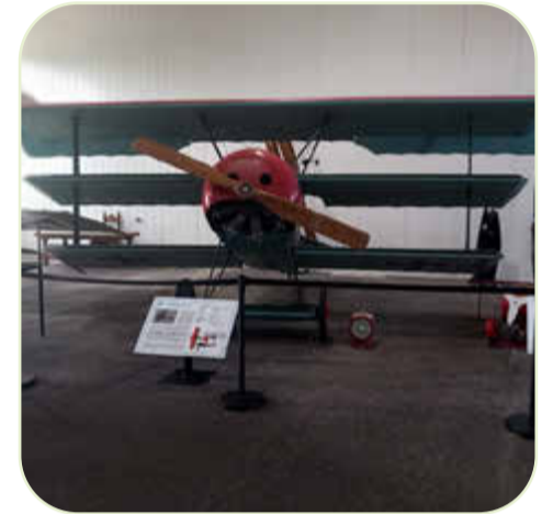
Fahrt für die Senioren aus den Feuerwehren des Amtes Laage S. 7