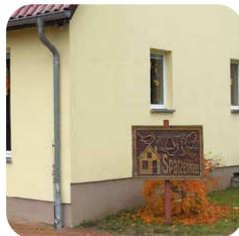
Laminat Depot - Lauft für die Naturkindertagesstätte Spatenhaus S. 4