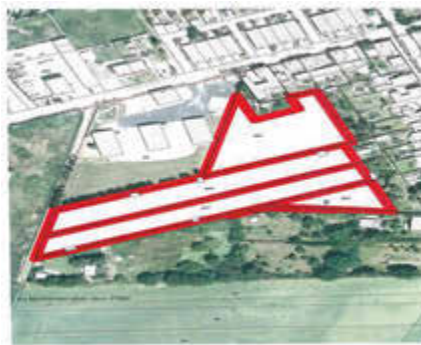
gez. Kirchner Bürgermeister

Das Angebot ist bis zum 30.10.2024 um 11:00 Uhr bei der Stadtverwaltung Allstedt, Forststraße 9 im verschlossenen Umschlag mit dem Hinweis „Ausschreibung Mühlstraße“ abzugeben.