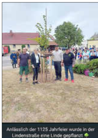
Anlässlich der 1125 Jahrfeier wurde in der Lindenstraße eine Linde gepflanzt 🌳