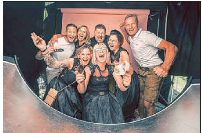
Matthias Ritzmann fotografierte zahlreiche Allstedter bei seiner Porträtaktion