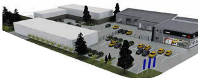
So soll das neue Autohaus einmal aussehen. Teile der alten Schuhfabrik (links) sollen erhalten bleiben. Eine Werkstatt (oben rechts) wird in den Neubau integriert.

Nach Fertigstellung wird das Autohaus Lisson einen Tag der offenen Tür veranstalten, um mit Kundinnen, Kunden, Geschäftspartnern, Freunden und Bekannten den Abschluss dieses großen Projekts zu feiern.