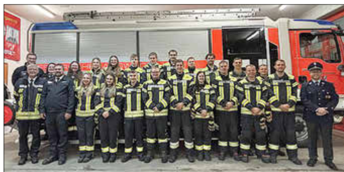
Alle Teilnehmerinnen und Teilnehmer haben an zwei Abenden die Leistungsprüfung erfolgreich bestanden.