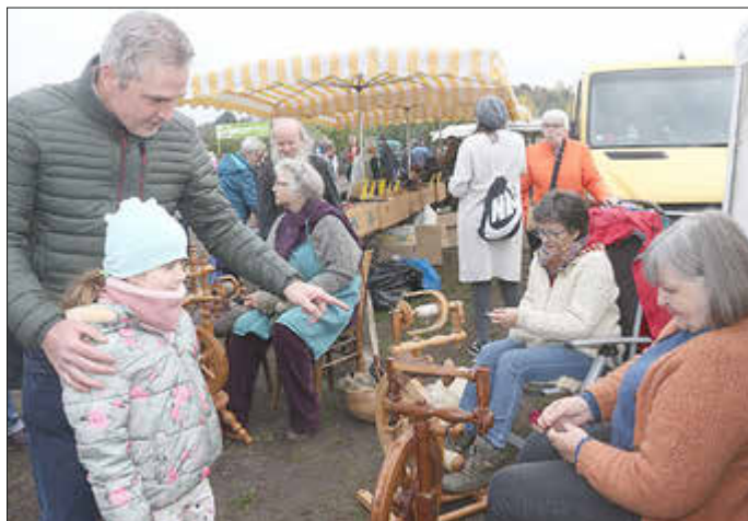
Die Spinnfrauen präsentierten ihr Können

Bewusst wurde auf eine Prämierung verzichtet. „Wir wollten in diesem schwierigen Jahr keine Prämierung durchführen, um besondere Tiere herauszustellen, weil die Situation in der Schafhaltung zurzeit sehr angespannt ist.“ Den Haltern sei nicht zum Feiern zu Mute. „Deshalb verzichten wir auf den Wettbewerb, für die Wahl der Miss Mayen und des Mister Mayen.“