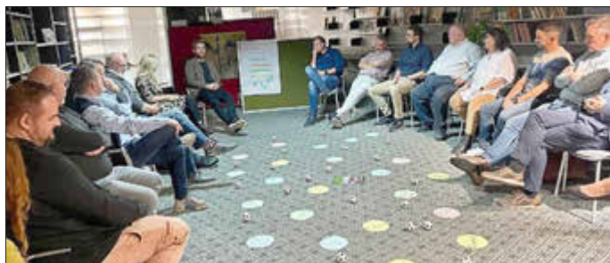
Ein reger Austausch in entspannter Atmosphäre beim ersten Kaminabend

Mayen. Das Nachwuchsführungskräfteprogramm, welches von der Stadt Mayen in Zusammenarbeit mit der Hochschule für öffentliche Verwaltung konzipiert wurde, ist in vollem Gange. Die Teilnehmenden treffen sich in regelmäßigen Abständen und werden in verschiedenen Bereichen geschult, gefördert und somit auf mögliche Führungspositionen in der Zukunft vorbereitet.