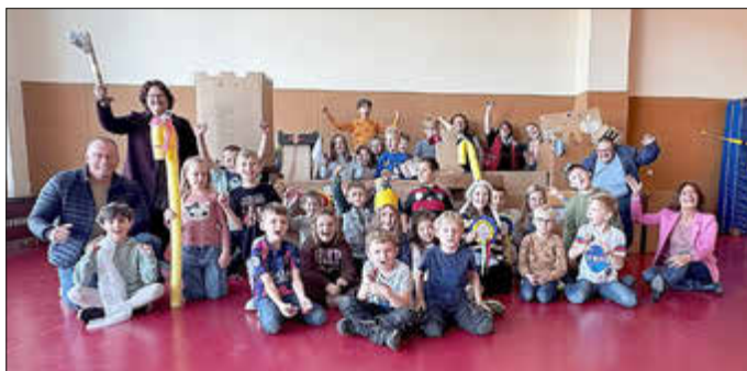
Bei der Prämierung der „besten Burgen“ gab es nur Gewinner.