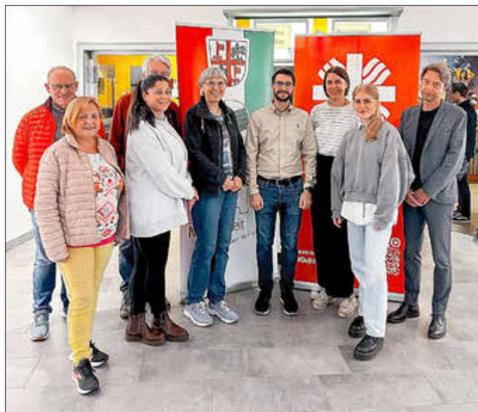
Für Menschlichkeit und Demokratie. Die Kooperationspartner vereint es, diese Botschaft nach außen zu vertreten.

Der Film zeigt die Lebensrealität vieler Klienten, die durch den Caritas-Migrationsdienst unterstützt und beraten werden. Das Aktionsbündnis „Unser Kreuz hat keine Haken“ setzt sich angesichts der aktuellen politischen und gesellschaftlichen Herausforderungen rund um die Themen Migration und Rechtsextremismus für Menschlichkeit und Solidarität ein. Das Bündnis will diese menschenfreundliche und demokratische Haltung sowohl innerhalb des Caritasverbandes stärken als auch nach außen transportieren.