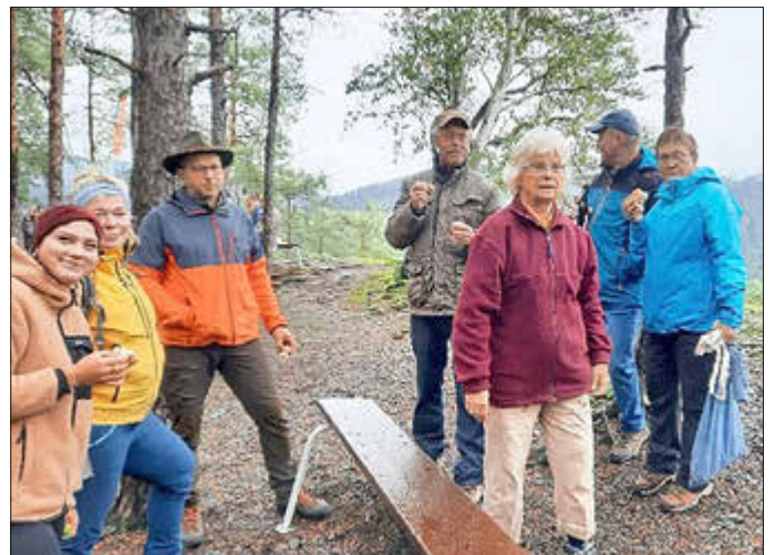
Besucher aus Limbach sowie Ober- und Unterloquitz