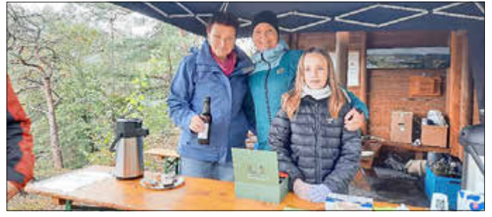
Kaffee und guter Kuchen von den Damen waren sehr begehrt