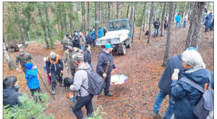
Es wird langsam Betrieb ...