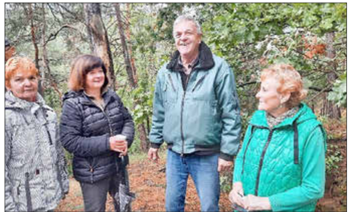
Im Kreise von Damen, der Vorstand - immer gut gelaunt