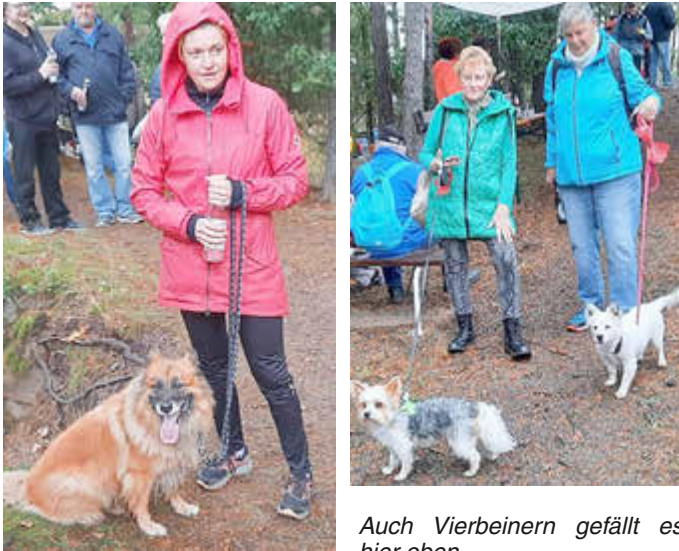
Auch Vierbeinern gefällt es hier oben