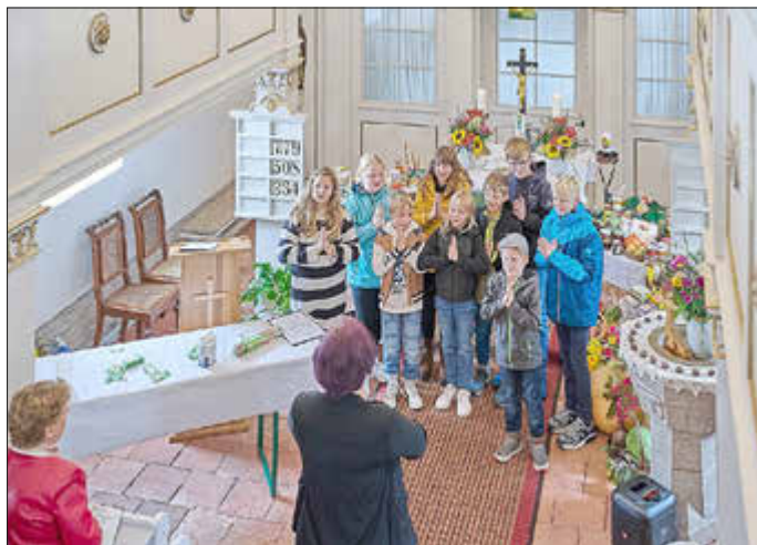
Ein Anspiel der Christenlehrekinder