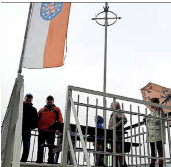
Natürlich wurde auch der Turm bestiegen

Im Anschluss begab man sich zum Spielplatz in Hohenwarte, auf dem die Kinder fröhlich spielen konnten, während die Erwachsenen bei einem kühlen Getränk ins Gespräch kamen. Der Spielplatz bot nicht nur Raum für Spaß und spannende Minigolfspiele, sondern auch für das Miteinander der Generationen - ein wichtiger Aspekt des Vereinslebens.