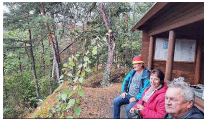
Die Ersten genießen die Aussicht ins Tal