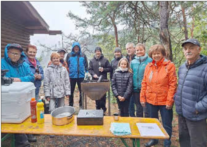
Die Organisatoren warten auf die Besucher