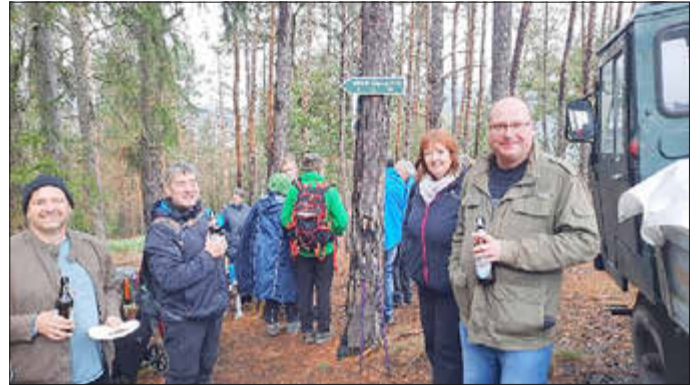
Nur gut, dass es „Saalfelder“ gibt ...