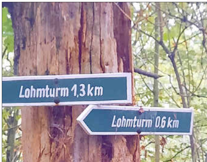
Steil oder bequem, je nach Kondition ...