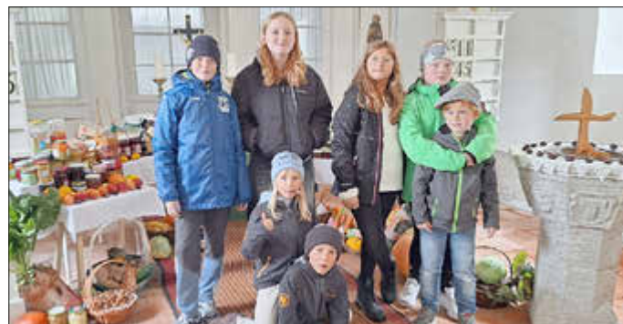
Die fleißigen Sammlerinnen und Sammler der Erntegaben