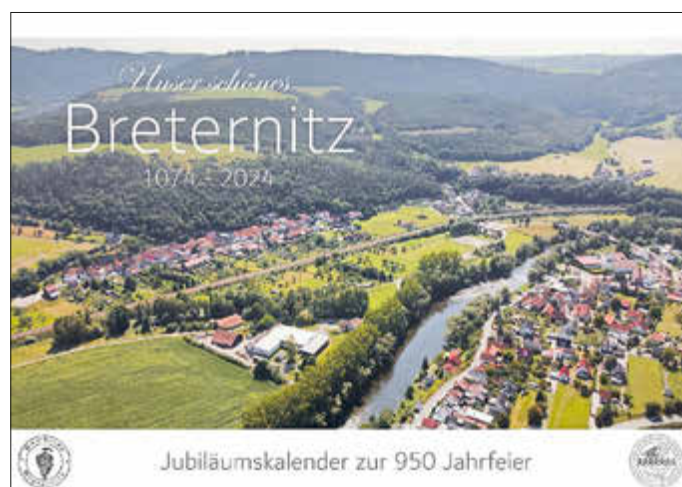
Jubiläumskalender zur 950 Jahrfeier

Marvin Oswald unter 015208932522 oder oswaldmarvin@icloud.com