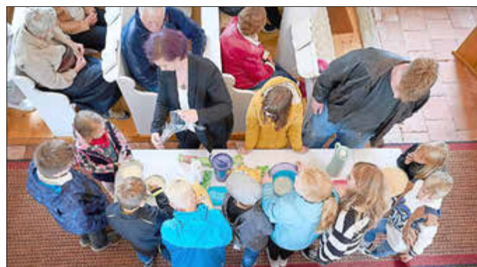
Der Hermann wird angerührt