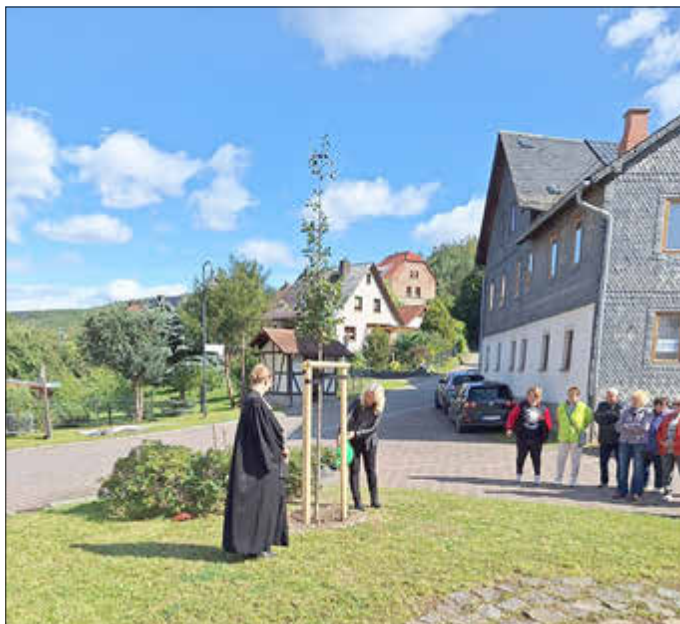
Am Dorfplatz bei der neu gepflanzten Linde