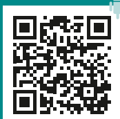
A.R.T. App für Android