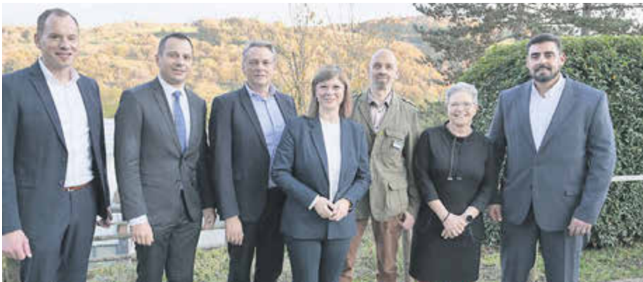
Die Verantwortlichen des Kreiskrankenhauses freuten sich gemeinsam mit Staatssekretärin Nicole Steingaß (Mitte) über das Jubiläum.

Ursprünglich wurde das Projekt mit dem Titel „150.000 Bäume für den Landkreis“ bereits 2019 vom Kreisausschuss beschlossen. Durch verschiedene Projektskizzen, Probleme bei der Suche nach Flächen sowie offene Finanzierungsfragen konnte erst im vergangenen Jahr mit einem Aufruf an Ortsgemeinden und Privatleute die eigentliche Umsetzung starten. Doch auch hier wurden nicht ausreichend geeignete Flächen eingereicht. Aus diesem Grund soll in der kommenden Umweltausschusssitzung über die nächsten Schritte im Projekt entschieden werden. Vorschläge hierzu wurden von Seiten der Unteren Naturschutzbehörde entwickelt.