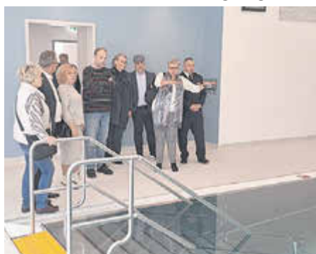
Die Gäste haben unter anderem das neue Frida-Kahlo-Schulzentrum besucht.

Infolge der Corona-Pandemie sind viele dieser Aktivitäten zum Erliegen gekommen.