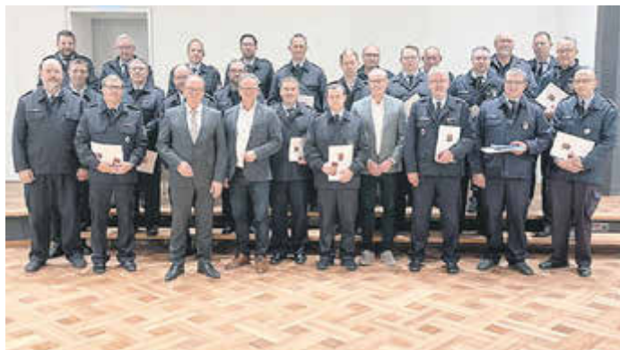
Insgesamt 20 Feuerwehrleute aus den Verbandsgemeinden Hermeskeil und Saarburg-Kell erhielten die Auszeichnung für 35 Jahre.