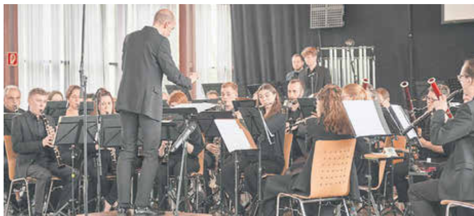
Am 24. November tritt das Kreisorchester im Bürgerzentrum in Schweich auf.