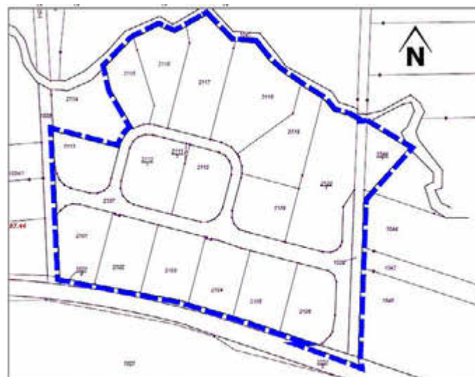
Auszug aus der Liegenschaftskarte (Quelle https://www.thueringen.livemaps.de/antragskennzeichen/686_5651_16_0050_vom_29_02_2024 ) https://www.thueringen.de/thp/fragliche/14584023141g9-11/download-offene-grundstueckskarte-liegenschaftskataster ) mit Ergänzung Kennzeichnung Geltungsbereich

Es folgte eine Untersuchung, in der Voraussetzungen für die Änderung in einem Verfahren gemäß § 13a BauGB für einen Bebauungsplan der Innenentwicklung im beschleunigten Verfahren geprüft wurden. In dieser Untersuchung wurde festgestellt, dass alle Voraussetzungen für diese Verfahrensweise erfüllt werden.