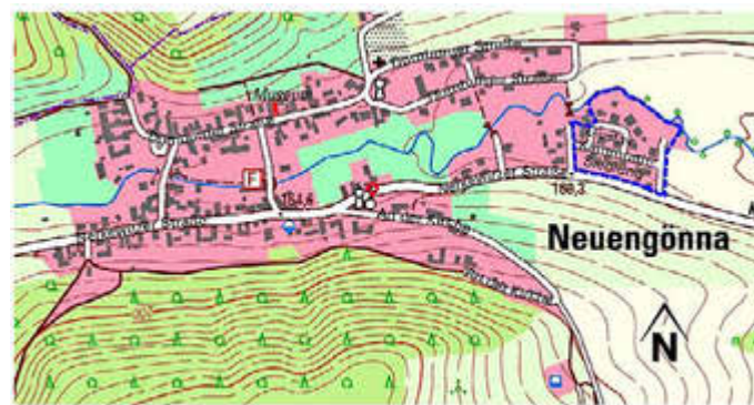
Auszug aus der TK 10 ( Quelle https://thuringenviewer.thueringen.de/thviewer/# ) mit Ergänzung - Kennzeichnung des Geltungsbereiches

Der Bereich der 1. Änderung ist in der Übersicht mit der fett gestrichelten Linie markiert.