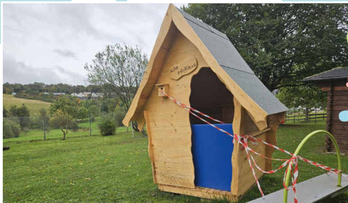
Expresslieferung für den Kitawald: das Wickelhäuschen wurde zur Kita transportiert