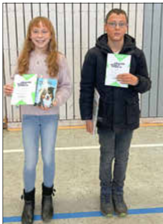
Die Gewinner des Vorlesewettbewerbs