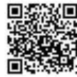
Video zur Hausapotheken-Ausstattung

Für Krankheitsfälle, die nicht lebensbedrohlich sind und bei denen ohne sofortige Behandlung auch keine bleibenden gesundheitlichen Schäden zu befürchten sind, die aber trotzdem nicht bis zur nächsten regulären Sprechstunde warten können, steht der Patientenservice 116117 bereit. Er bietet eine medizinische Ersteinschätzung der Beschwerden – entweder online unter 116117.de mithilfe des Patienten-Navis oder telefonisch durch medizinisch qualifiziertes Personal.