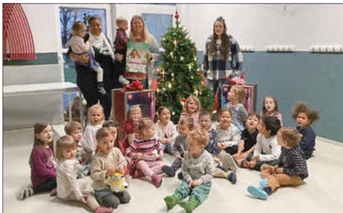
Förderverein überrascht Kinder und Team mit einem Weihnachtsgeschenk.

Der Förderverein der Kita hat sich einmal mehr als wichtiger Partner der Kita erwiesen und trägt dazu bei, den Kindern einen unvergesslichen Kindergartenalltag zu ermöglichen.