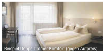
Beispiel Doppelzimmer Komfort (gegen Aufpreis)