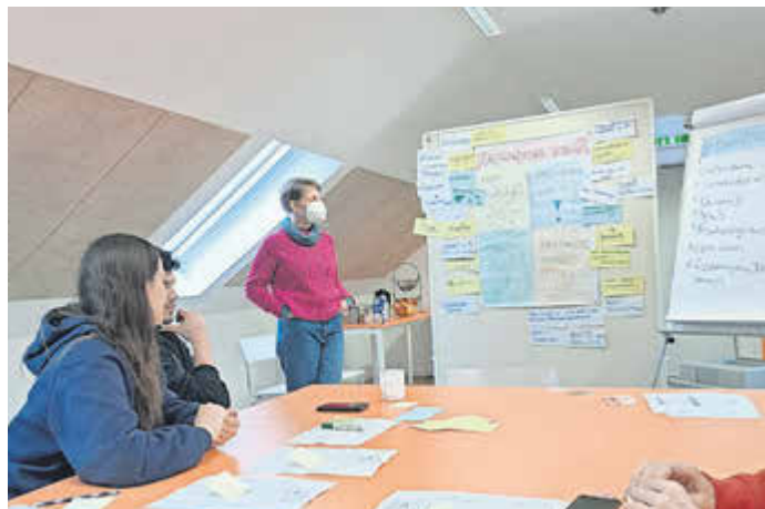
Gemeinsam wurden die Grundlagen des Wahlsystems erarbeitet.