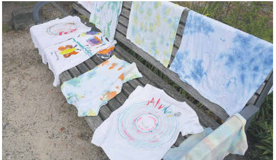
Die Teamer:innen bemalen beispielweise T-Shirts zusammen mit den Kindern.

Die sogenannten Teamer:innen müssen mindestens 18 Jahre alt sein und sollten Interesse an der Kinder- und Jugendarbeit mitbringen. Vorab werden