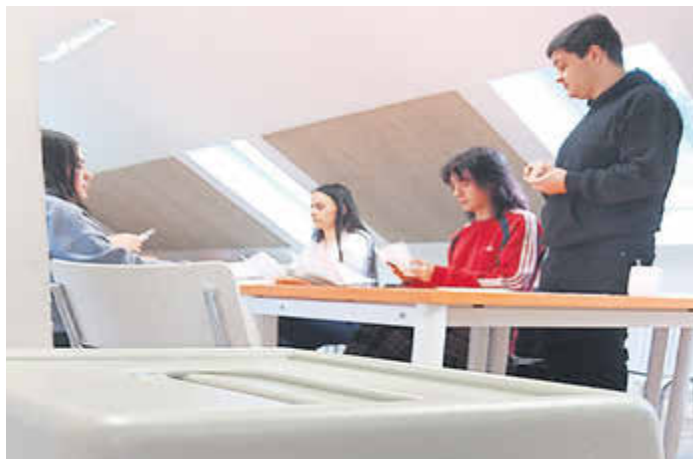
Die Teilnehmenden beim Auszählen der Wahlstimmen.