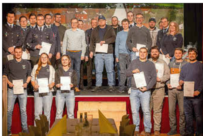
Aktive Feuerwehrdienstleistende erhielten die „Fluthelfer-Nadel“ vom Freistaat Bayern für den Einsatz beim Hochwasser 2024.