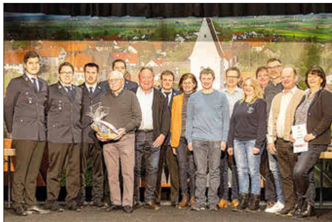
Ehrung langjähriger Vereinsmitglieder